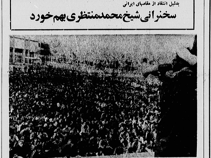
محمد منتظری، دیروز، در حالیکه بلندگویی بدست داشت، در دانشگاه سخنرانی کرد.

بذلیل انتقاد از مقامهای ایرانی سخنرانی شیخ محمد منتظری بهم خورد