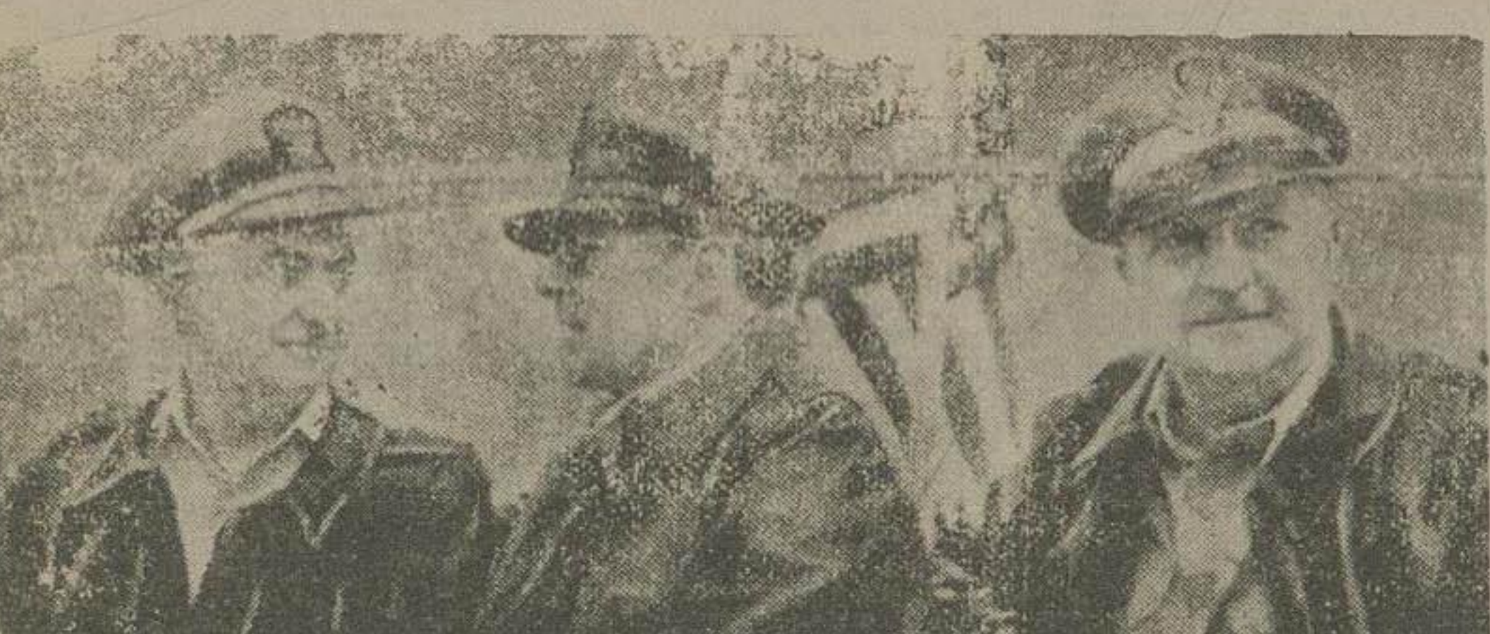
ژنرال ماک ارتور فرمانده کل نیروهای ملل متحد روز شنبه بعد از ظهر با هوایی مخصوص خویش همراه ژنرال استرل فرماید، ناوگان و ژنرال وینات معاون خویش رفراز میدا های چند پرواز کرد عکس بالا ژنرال موزور با همراهان خویش هنگام مراجعت در فرودگاه تو کونشان میدند. عکس از یونایتد پرس»

همه شب گذشته سر بازان کمونیست با اثر یک حمله ناگهانی، سر بازان امریکائی و کره جنوبی را قریب یازده میل بعقب رانده و شهر تو کچین را تصرف کرده اند. شکست دیشب، بر وحیه سر بازان ملل متحد لطمه زد.