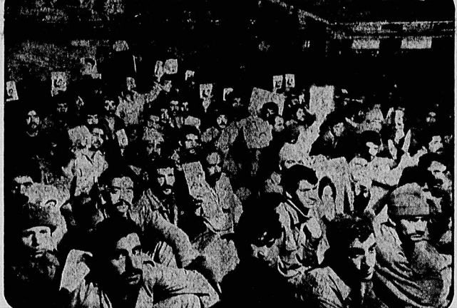
۵۰۰ اسیر از ۲۰۰۰ اسیری که روز ۲۸ صفر در حمله تهاجمی نیروهای مسلح ایران به دام افتادند، در حالیکه شمار مگر صدام و درود پرام خمینی می دادند، با نظار از هوازن به تهران انتقال یافتند. در صفحات ۱۰ و ۱۱

صدام تکریتی نامرد سال ۱۹۸۰ مقاله ای از: دکتر حسین ابوترابیان در صفحه ۱۲