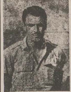
دکتر حسین میرزایی وزیر اقتصاد ملی و مأمور فوق العاده دولت فرخوزستان، در پیش دعوتی از جمعی از اهالی اهواز در باشکاه شهرنوده بود.

وزیر اقتصاد ملی در جلسه ۱۹ نفری پیمان اهواز مشغول اقدام است که با همت شما آقایان محترم گواشته اند امر امر حیات کند.