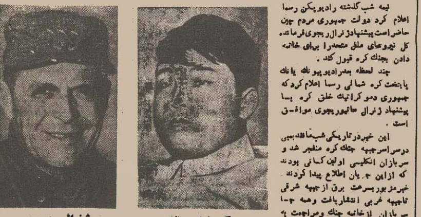
کیم ایل سونگ رئیس دولت کره شمالی