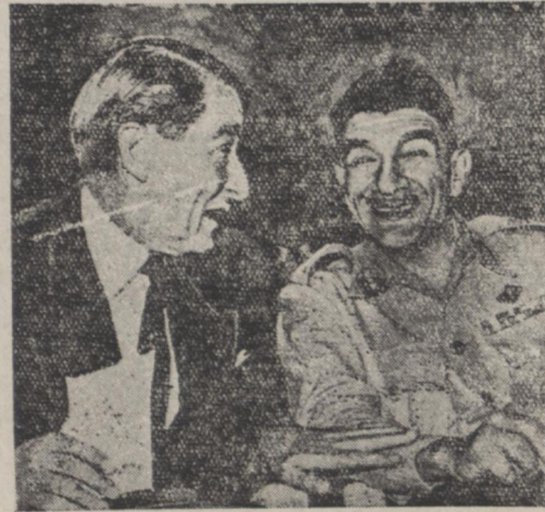
ژنرال نجیب نضت وزیر مصر در پایان نخستین جلسه مذاکرات در باب موضوع تخلیه کانال سوئز مدتی با رالف استینسن سفیر کبیر انگلیس در قاهره مذاکره میکرد و سعی نمود سفیر انگلیس بنهاند که دولت مصر حاضر نیست با نایندگان انگلیس بر سر مسئله تخلیه کانال سوئز چانه بزند

واشنگتن - سفارت کبری مصر در واشنگتن درباره مذاکرات بین مصر و انگلستان اعلامیه ای انتشار داد و تصریح داشت که دولت انگلستان در حل مسئله سوئز مشکلات داخلی خود را در نظر گرفته و بر جنبه های بین المللی مسئله آفتور که باید و شاید توجه نداد