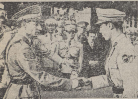
در جشن سالانه سواری و ورزشی دانشکده افسری که بعد از ظهر روز پنجشنبه در پیشگاه اعلیحضرت همایونی و با حضور چندین از آقایان و ذهران و نمایندگان مجلس و افسران ارشد و رجال صورت گرفت در حدود پنجاه تن از قهرمانان سواری دانشکده بدریافت جوایز نائل گردیدند. در عکس بالا شاهنشاه هنگامیکه بایکی از قهرمانان سواری دست میدهند دیده میشوند.