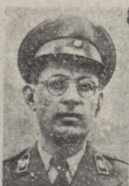
آقای سرهنک دکتر هایماض دادستان نظامی

قرار اطلاع از طرف فرمانداری نظامی صورتی تهیه شده که متضمن اسامی افرادی است که برای اشفال پشهای دادگاه دادسرای نظامی در نظر گرفته شده اند و صورت مزبور اکنون مورد مطالعه مقامات وزارت دفاع ملی است و فرار است نظر خود را در این خصوص اعلام نایبته اسامی اعضای دادگاهی که به توطئه قتل افسار طوس رسیدگی خواهند کرد نیز جزء این صورت است.