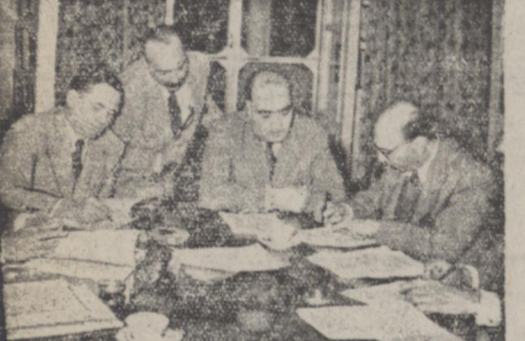
در عکس بالا آقایان دکتر فرمانبرمایان کجیل وزارت بهداری - مهندس معضی وزیر پست و تلگراف - دکتر مقدم عضو اداره برنامه و وادان رئیس اداره اصل چهارم هنگام امضای قرارداد های مزبور دیده میشوند

موجب این فرار دادها یت عده متخصص فنر برای بهداشت و کارهای لایر اتواری تربیت خواهند شد