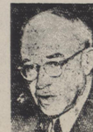
برادلی رئیس سابق ستاد مشترک امریکا

اسانبول - اعضاء یک کمیسیون پارلمانی یوگوسلاوی بریاست موشه بیچانه معاون رئیس جمهوری آن کشور که در نظر دارند با مقامات دولت ترکیه مذاکره کنند باستانبول وارد شدند