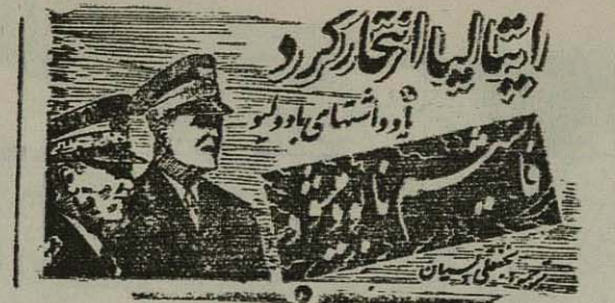
آقای... (Caption text describing the person in the image)