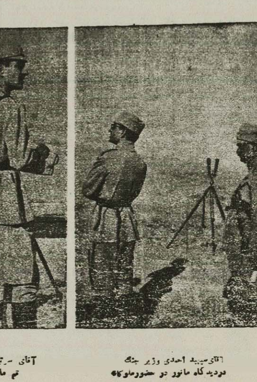
آقای سید احمدی وزیر جنگ در دیدگاه مانور در حضور مولوکا

روز سه شنبه ۲۶ شهریور ماه بناسبت پایان اردوگاه تابستانی لشکرک مانور بزرگی با تیرهای ختینی جنگی بوسیله یک هتک پیاده و دو آتشبار توپخانه ۱۰۰۰ ممراتی و ۲۵ کوهستانی از واحد های لشکر یکم پادگان مرکز در ساعت چهار و نیم بدواز ظهر در پیشگاه اعلیحضرت هایونی رئیس و رئیس ستاد بوشهر و سایر افرای و افسران ارشد ارتش در منطقه لاله و اجراء شد که از لحاظ تیر ها و زنی و تطبیق آتش حای توپخانه و پیشروی نیرو های پیاده نظیر دیروز آتش فوق العاده جانب توجه و مورد تحسین اعلیحضرت هایون شاهنشاهی واقع گردید