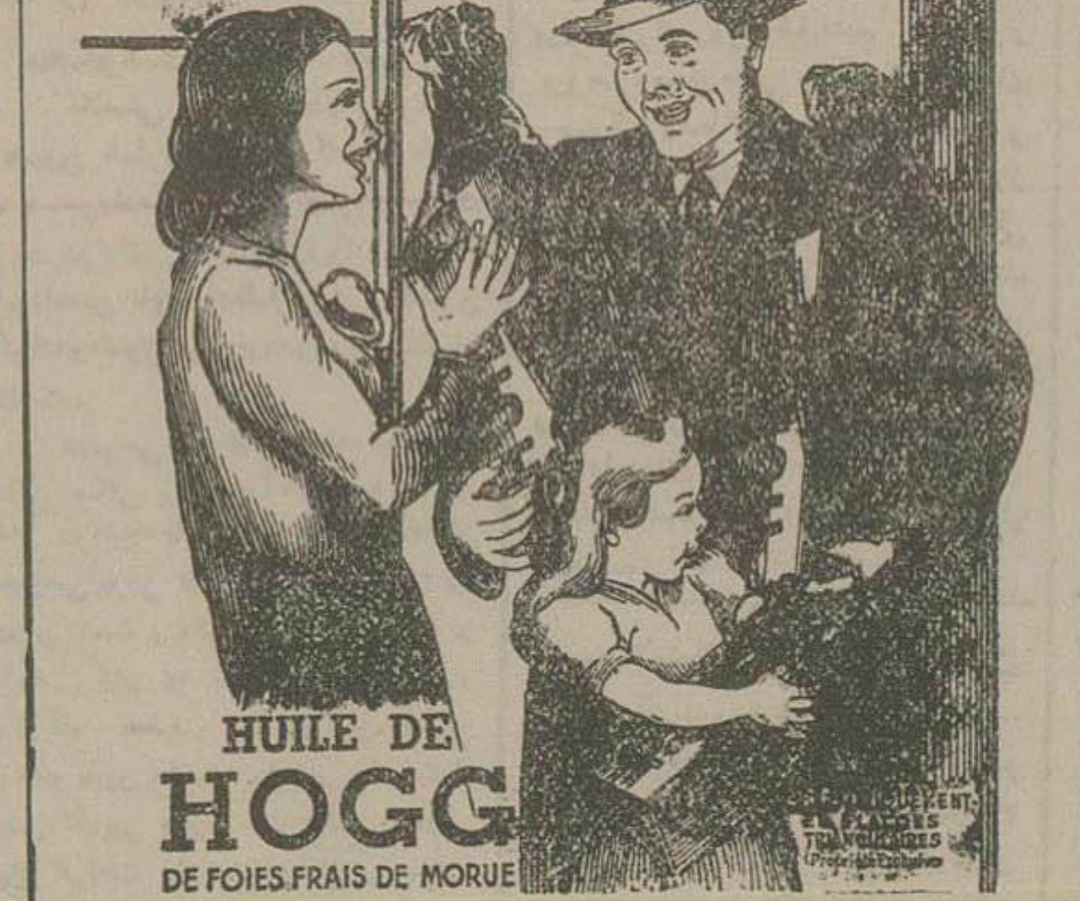
HUILE DE HOGG DE FOIES FRAIS DE MORUE

یک صفحه دیگر از تحقیقاتی که جزوات در باره خانم و شوهرش پیل آمد حاکی بود که آنها مدتی با باشگاه ژاپنی ها ارتباط داشته اند و شوهر خانم هینکی دلار رسی ژاپنیها بوده و اغلب معاملات تجاری ژاپنیها بوسیله او انجام میشده است. اکثر قران نیروی دریایی ژاپن در دوره پیل از جنگ هر وقت بنادر امریکا می آمدند سرافی از شوهر خانم هینکی میسر رفتند ولی این هم جرم نیست چون این ارتباط ها همی پیش از واقعه پیل قار بود و بعد که امریکا و ژاپن با هم رابطه تجارت داشتند.