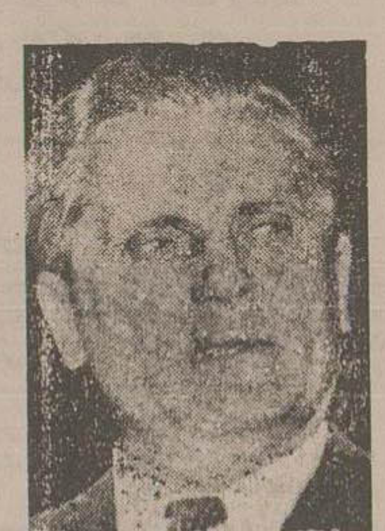
مارشال آنتونی ایشوای یوگسلاوی