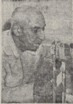
آقای دکتر مصدق نخست وزیر هنگام فرات پیام خویش

دو ساعت بعد از ظهر امروز پیام آقای نخست وزیر خطاب به ملت ایران که در فوراً مخصوص ضبط شده و بشرح زیر بوسیله رادیو تهران ابشار یافت