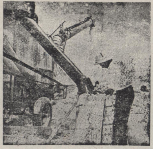
در این عکس یکی از کارگران هنگامیکه بوسیله ماشین خرمن کوبی معصول کند هر اجمع آوری میکند دیده میشود

ماشین دو کون همدستگاه نسبتا بزرگی است که بوسیله یک نفر راننده که در هر یک از دستهای بزرگ کتم بوسیله های مخصوص تمام آنها را با بن بسته بندی میکند و از سوی دیگر بچارج تراب میکند.