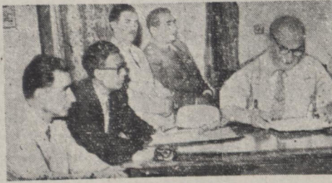
آقای راد رئیس اداره فرهنگ شهرستانها و چند تن از روسای فرهنگ شهرستانها در کنفرانس مشورتی مشاوریته میباشند

ساعت ۷ بامداد امروز کنفرانس مشورتی روسای ادارات فرهنگ شهرستانها شرکت مدیران کل و معاونین و روسای ادارات کارگرفتی، فرهنگ شهرستانها و آموزش روستایی در حضور آقای وزیر فرهنگ در اداره هنر های زیبا افتتاح شد. آقای دکتر آذر وزیر فرهنگ پس از تشریح از حضار درباره چگونگی انجام امتحانات نهایی و وظائف معلمین بیاناتی ایراد کرد و از جمله خطای به روسای فرهنگ شهرستانها اظهار داشت بعضی از معلمین با بهیبت مشورتی که بر همه دارند واقف نبوده و دست بان مشورتی تغییر نمی اندیشند و این از وظایف شما است که با رادشاورانه ای و پند و اندرز آنها را بویافیه خود آشنا سازید و در خانه در باره بهبود وضع فرهنگ شهرستانها نیز سخنانی گفت و اظهار امیدواری کرد که با برقراری این گونه کنفرانس ها مشکلات و مشکلات امور رفع شود و وضع فرهنگ شهرستانها بهبود یابد. سپس آقای معصومیان رئیس فرهنگ شهرستانها نیز در این زمینه اظهاراتی کرد. آنگاه آقایان روسای فرهنگ بده وست از روی برنامه ای که قبلاً تعیین شده بود تقسیم شده و شروع بکار نمودند. جلسات کنفرانس مشورتی پنج روز طولی انجام خواهد شد و در روزهای اول و دوم روسای ادارات کارگرفتی و آموزش روستایی و ادارات کل ساختمان و فرهنگ شهرستانها نیز تشکیل شود و در باره تقاضاها و احتیاجات و رفع مشکلات مربوط به فرهنگ استانها و شهرستانها رسیدگی بعمل آید. همچنین آقایان دکتر آذر وزیر فرهنگ و معاونین هر یک با مقامات تعیین نموده اند که آقایان روسای فرهنگ با ایشان ملاقات نمایند.