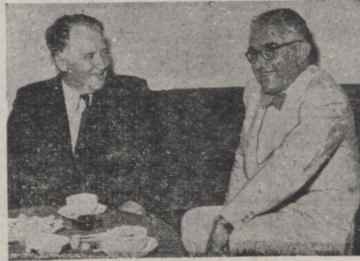
آقای لاورتیف سفیر کبیر شوروی در جلسه ملاقات امروز با آقای مفتاح معاون وزارت خارجه

آقای لاورتیف سفیر کبیر جدید شوروی در ایران نیساعت بعد از ظهر امروز با آقای مفتاح معاون وزارت خارجه ملاقات کرد و رونوشت استوار نامه خود را تسلیم وی نمود، در این ملاقات معاون وزارت خارجه سفیر کبیر جدید شوروی تبریک ورود گفت و اظهار امیدواری کرد که با مسامحه و اقدامات ایشان روابط دوستانه دو کشور ایران و شوروی بسط و استحکام بیشتری پیدا نموده و اختلافات فی مابین مرتفع شود و زمینه مساعدتری برای توسعه مناسبات بازرگانی و عقد قرار داد های جدید فراهم گردد. سفیر کبیر جدید شوروی که از مامورین عالی مقام و ورزیده وزارت خارجه شوروی میباشد در جواب بیانات معاون وزارت خارجه مطالبی بقیه در صفحه دوم