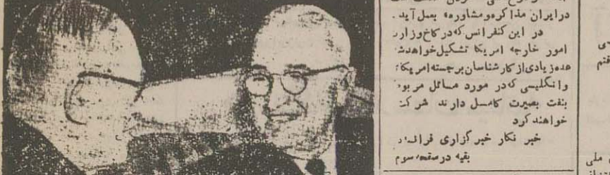
رئیس جمهور فرانسه وارد کانادا شد

موضوع جنگ کره یکی از مسائل آروم - آروم - قرار خواهد گرفت