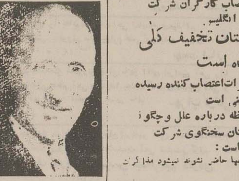
فردا بکشور هاشمی اردن می‌رود