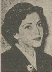
والا حضرت شمس ریاست عالی جمعیت شیرو خورشید