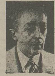
آقای سرلشکر دکتر هدایت