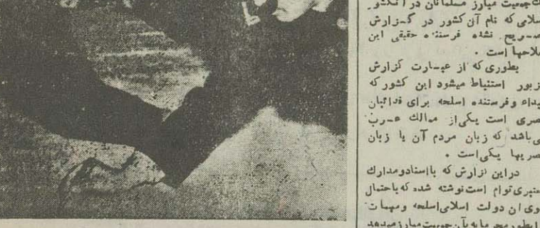
مذاکرات بین نمایندگان کویت که شمالی و امریکاییها در شهر «پاناجور» با علامت گذاری روی نقشه ادامه داده