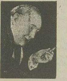
چرچیل نخست وزیر انگلستان