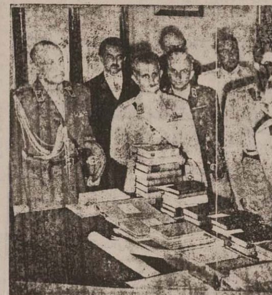
دانشکده افسری عصر دیروز بیست و هشتمین دوره فارغ التحصیلی دانشکده را در پیشگاه شامشاه جشن گرفت...