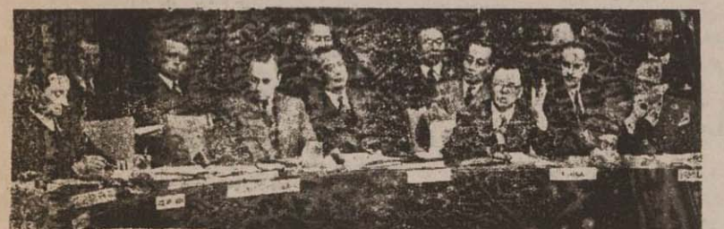
جلسه دیروز شورای امنیت، از چپ بر راست: الکساندر بیلر نایب، یو کلاوی نوورو نایب، لوادر دکتر تیمیاک نایب، چین هنگام ایراد تلقی و اوارسک نایب، هلند...