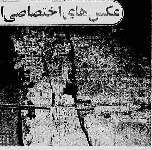
عکس های اختصاصی اطلاعات از فراز بغداد