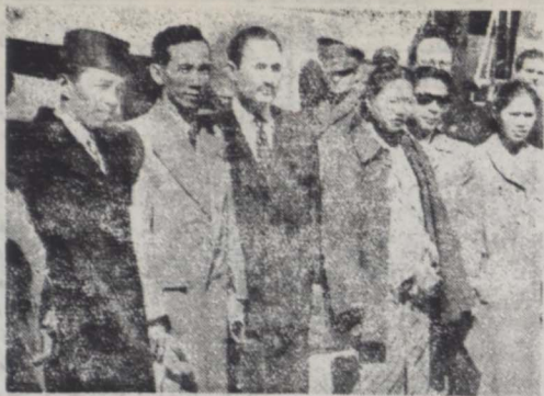
اعضای هیئت نمایندگان دولت اندونزی هنگام ورود در فرودگاه مهرآباد