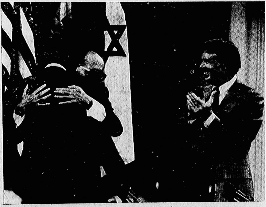
دو نوکر یکدیگر را در آغوش میگیرند تا از خوشحالی آنها خوشحال شود