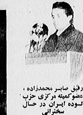
رئیس صابر محمدزاده، عضو کمیته مرکزی حزب سخنرانی

توضیح درباره مقاله! توضیح درباره مقاله! توضیح درباره مقاله! توضیح درباره مقاله!