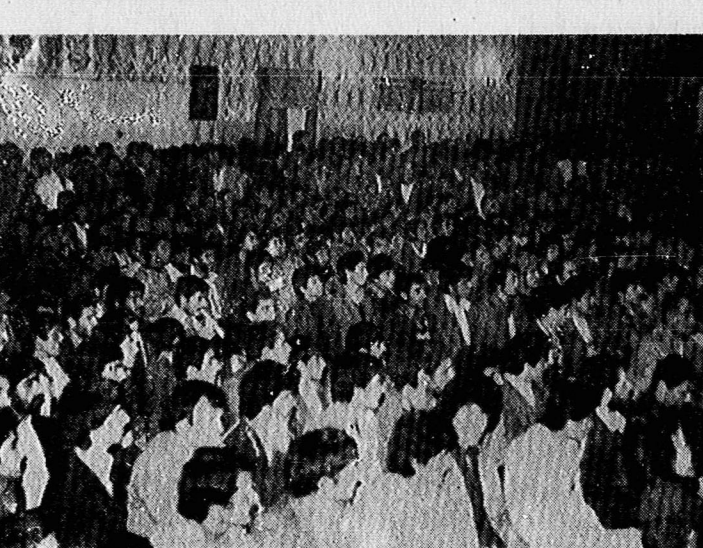
گوشه‌ای از جلسه سخنرانی حزب در کرگان

سیاست‌های دوپهلوی و محافظه کارانه از نوع سابق، قابل تحمل ملت ایران نیست. سیاست‌های دوپهلوی و محافظه کارانه از نوع سابق، قابل تحمل ملت ایران نیست.