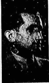
رفیق بقراطی از قدیمی ترین مبارزان جنبش کارگری و یکی از ۵۳ نفر بود

عضو کمیته مرکزی حزب توده ایران یکی از قدیمی ترین مبارزان جنبش کارگری ایران در ۲۷ سالگی در ۱۳۵۸ درگذشت. رفیق محمود بقراطی چهره شناخته شده ای است که از عنوان جوانی به مبارزه علیه رژیم پهلوی پرداخت و برای رسیدن به هدف، راه حزب توده ایران را انتخاب کرد. رفیق محمود بقراطی، که از اعضاء گروه ۵۳ نفر بود، در سال ۱۲۸۳ در کربلا متولد شد و پس از مدتی به دنبال کشتی میازان به ساس خود به تهران آمد. تا اینکه در سال ۱۳۱۷، همراه با اعضاء گروه ۵۳ نفر دستگیر، محاکمه و به دسالم حبس محکوم شد. او هنوز در زندان بود که درخواست عضویت در حزب توده ایران را کرد. او پس از ۵۳ سال از زندان آزاد شد. در حالی که جورج وستم رژیم منحوس پهلوی پیش از سایر رفیقان پروری اثر گذاشته و او را به شدت شکنجه و تحقیر کرده بود. بر هم تمام مشکلات، رفیق محمود بقراطی، سرفراز و سر بلند به فعالیت خود در حزب توده ایران ادامه داد و خدمات ارزنده ای به جنبش کارگری کشور کرد. مبارزات او در اسفهان و در جهت تشکیل مبارزات کارگران بکوته ای بود که روزنامه رهبر ارگان حزب ما او را «فهرمان جنوب» نامید. رفیق بقراطی، که دامینج مبارزه را بخوبی دریافته بود، هنگام انتصاب خلیل ملکی به مبارزه گسترده ای علیه وی دست زد. وی در دومین کنگره حزب توده ایران به سمت عضویت کمیته مرکزی انتخاب شد. او مجدداً در سال ۱۳۲۷ به زندان شاهنشاهی