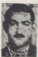
بامضای عده‌ای از روزشکاران

بامطالب شیرین و متنوع خود عصر یکشنبه منتشر میشود.