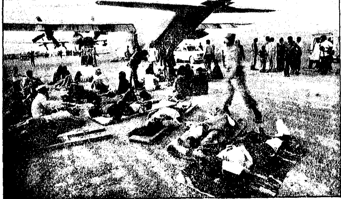
هوایماهای ارتش، با سرباز و پتو و پزشکی، به یاری بازماندگان رفته است. زمین پر از جنازه است. زمین پر از مجروح است. در این زلزله جانخوارش. آنقدر آدم مرده است و آنقدر دست و پا شکسته است که از حساب بیرون است.

نیروی دریائی شاهنشاهی استخدام مینماید نیروی دریائی شاهنشاهی جهت تکمیل کادر افسری - دریافتی - درجه‌داری تعدادی داوطلب با مدرک تحصیلی لیسانس (ریاضی - فیزیک - کامپیوتر) دیپلم ریاضی و طبیعی نظام قدیم آموزشی و ریاضی فیزیک و علوم تجربی نظام جدید آموزشی و هنرستان‌های فنی و سوم متوسطه یا معادل آنرا استخدام و جهت تحصیل بکشورهای آمریکا و اروپا اعزام مینماید. داوطلبین جهت کسب اطلاعات بیشتر و ثبت نام میتوانند به‌مدیریت استخدام نیروی دریائی شاهنشاهی واقع در خیابان عباس‌آباد غربی مقابل پست بترین مراجعه نمایند.