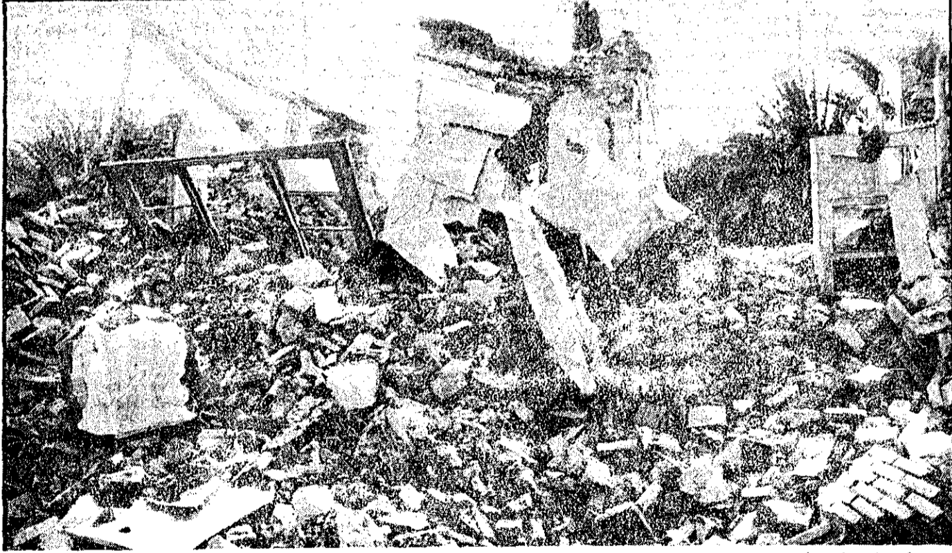
حتی یک خانه سالم نماند، نخستین تکان زمین که پایه‌ها را لرزاند، به چشم بهیم‌زدنی خاک و آجر را درهم کوبید و اثری از آبادانی بجا نگذاشت از دوازده هزار جمعیت طبس، نود درصد در کمند این خشم نابجا جان سپردند.

* ۷ هزار نفر از نقاط مختلف خراسان به کمک زلزله زدگان رفتند. * یزشکان منطقه: اگر اجساد امسروز بیرون آورده نشود، خطر شیوع چند نوع بیماری وجود دارد.