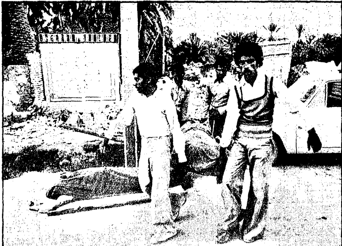
در طبل، زندگیاں آند کاند و مردگان اسرار... جسد را به نخته شکسته‌های نهاداند و در طول خیابانها و گذرهای شهر ویران شده نهاداند تا یک یک به گورستانها حمل شود.