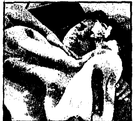
ادم خیال می‌کند طفلکی شاخهای گل به دست گرفته است و با عبادت کندهای برایش گل برده است. اما، فاجعه که رخ داد، بجای گل، سر و صورت بچه‌ها را باندو پنبه پر کرد.

حوادث ۱۳۰۰ دوشنبه ۲۷ شهریور ۱۳۵۷ - ۱۵ شوال ۱۳۹۸