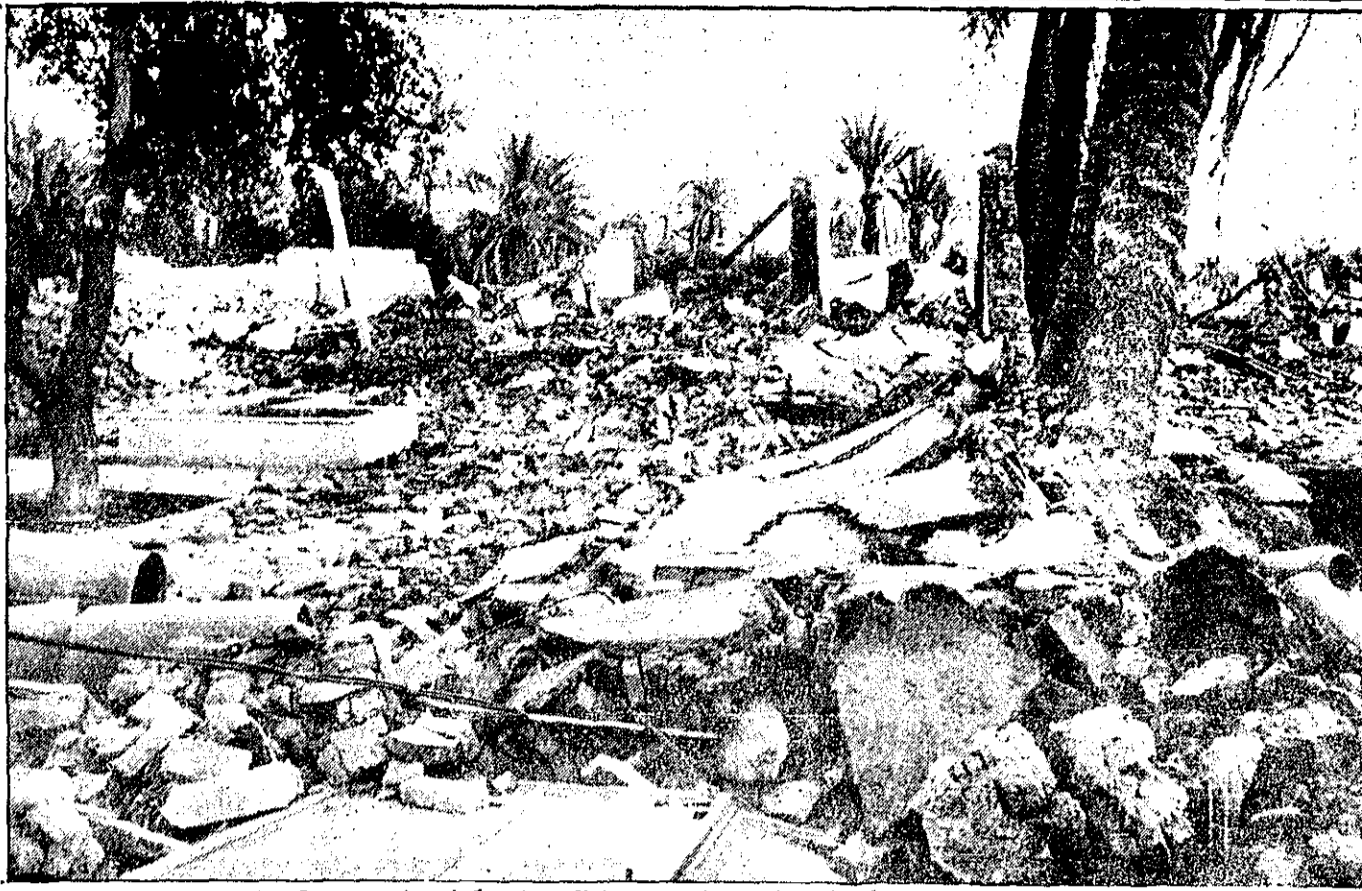
... و روزها هم که توبخانه و خمپاره کار کند، شهری را چنین به خاک در نمی کشد. طبیعت چه آتشبار عجیبی دارد.