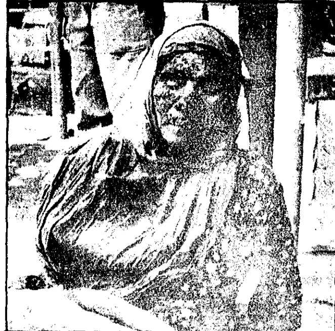
تمام چهره‌ها در این صحنه‌ها چهره‌ها کیمیا نیست، اما، دردی چنین کشنده، جز در چهره‌ها که شامه‌ها نمانده‌اند نمی‌شود. این زن دردناک، مثل بسیاری از مادران و خواهران ما، شهید داده است.