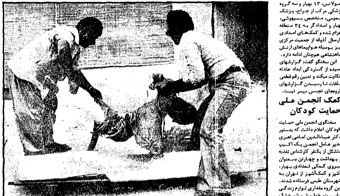
وقتی که شهری یکبارچه ویران شود، بچه‌هایی هم که باید در باغها بدون پروانه بگیرند، به این روز اسراقتند. چه اندوهبار است مصیبتی چنین غیر آسیر.

تبریز: خبرنگار کیهان - به دستور دادستان استان آذربایجان شرقی یسکیز از دادیاران استان مأور رسیدگی به وضع زندانیان تبریز شد تا آن عده‌ای را که استحقاق عفو دارند معرفی نماید. مدستوی دادستان استان در این مورد اظهار داشت چون همه ساله به مناسبت چهارم آبان استفاده نگرداند.