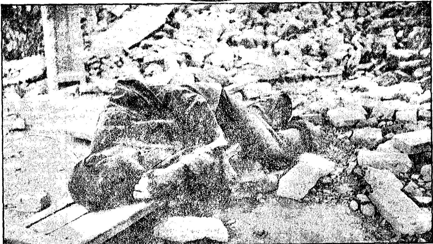
زلزله خانمان برانداز طبس، زندگی را در این شهر قدیمی خونین کرد. آوار چنان سنگین و فرلوان است و تعداد کشته‌شدگان آنقدر زیاد که هنوز هم جسد از زیر خاک درمی‌آورند. این کشته، یکی از قربانیان این فاجعه است.

کمک آیات عظام به زلزله زدگان * در طبس حتی یک ظرف آب پیدا نمیشود * از ۱۵ هزار کشته، جسد ۶۰۰ نفر از زیر آوار بیرون آورده شده است.