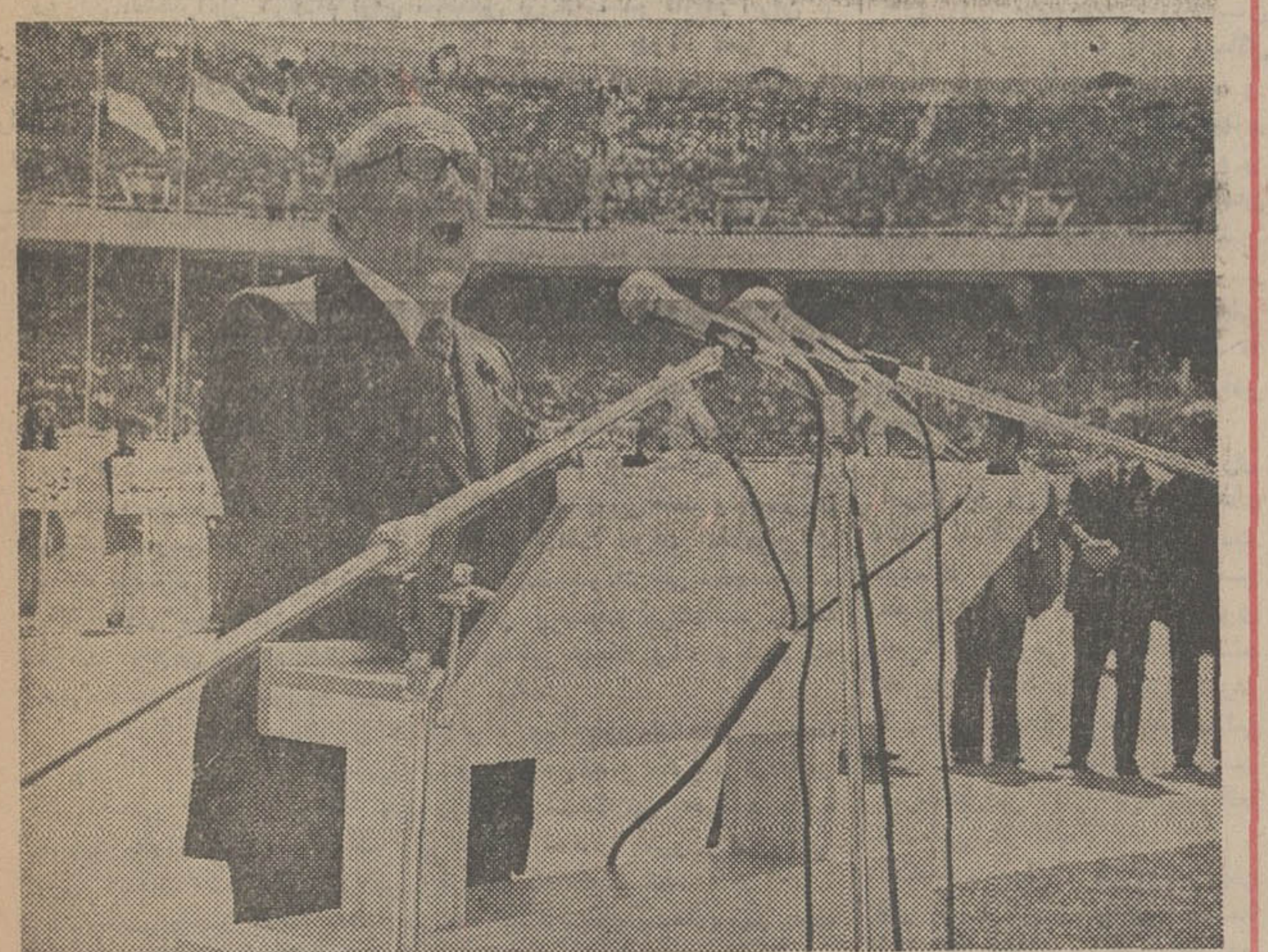
هویدا نخست وزیر و دبیر کل حزب رستاخیز ملت ایران دیروز در آئین سیاسی، گزارش شکل حزب یگانه واحساسات پرشور ملت ایران را بعرض رساند