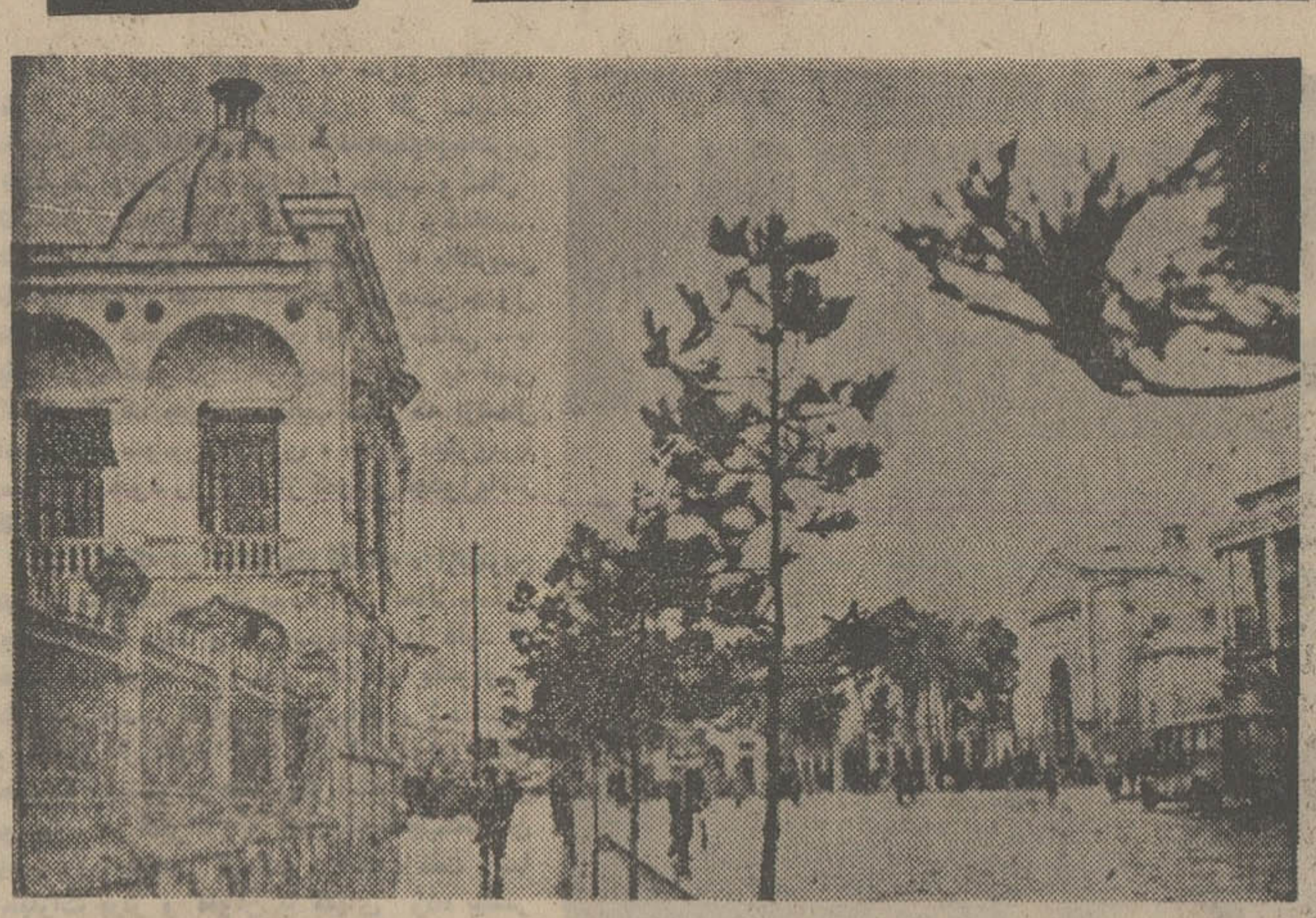
از مناظر طهران - خیابان ناصر خسرو «سابقه سابق» میدان سپه وارد میشود.