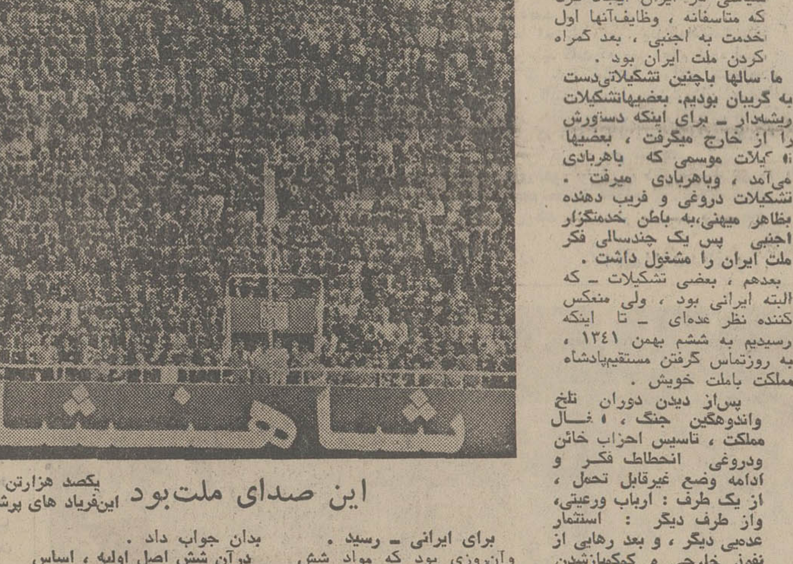
هویدا نخست وزیر و دبیر کل حزب رستاخیز ملت ایران دیروز در آئین سیاسی، گزارش شکل حزب یگانه واحساسات پرشور ملت ایران را بعرض رساند