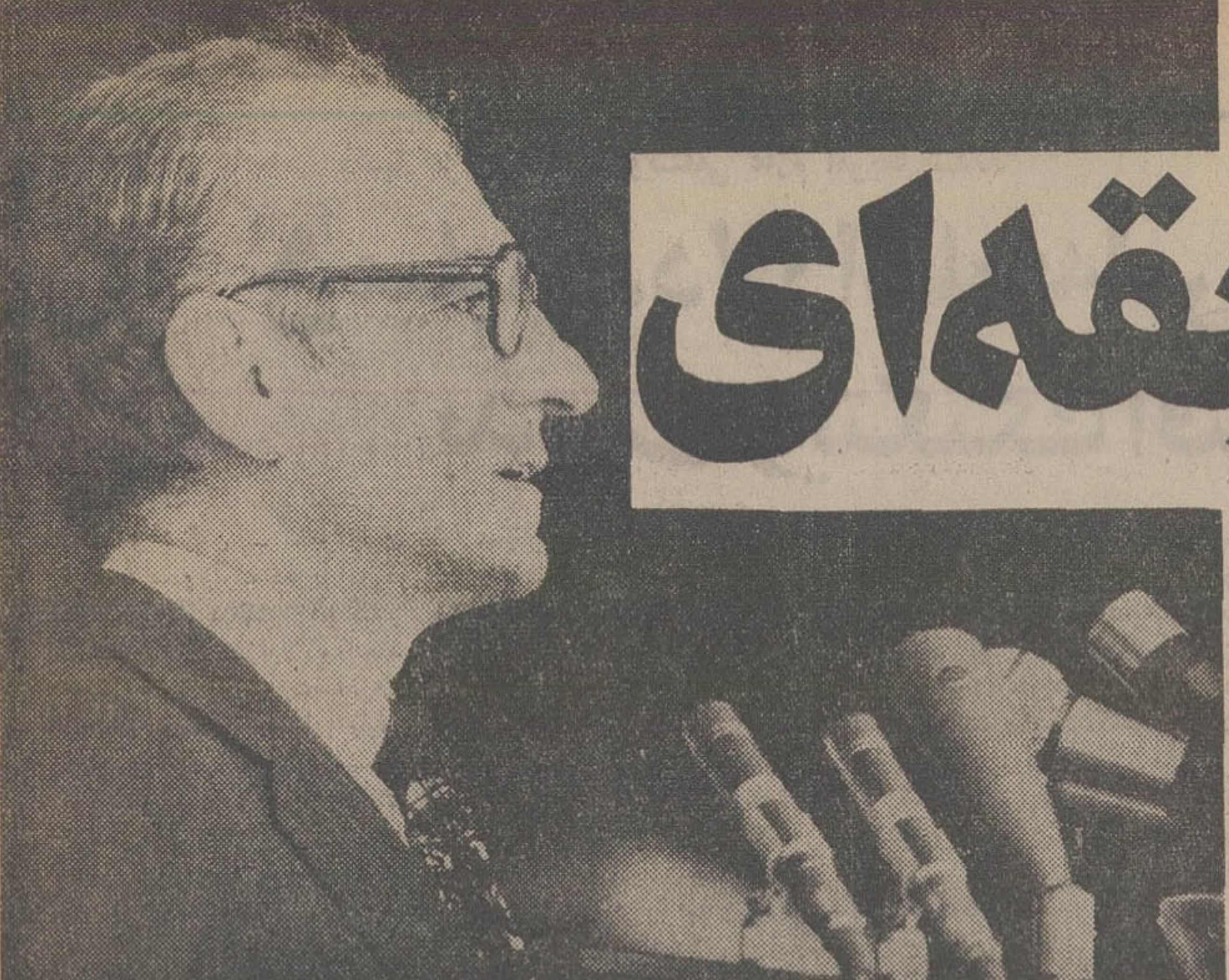
شاهنشاه دیروز در مراسم سیاسی که پیش از یکصد هزار نفر از نمایندگان طبقات مختلف در ورزشگاه آرپامهر برپا کرده بودند بیانات مهمی خطاب به ملت ایران ایراد فرمودند.

شنبه ۱۳ اردیبهشت ماه ۱۳۵۴ - شماره ۱۴۶۹۶ - تک شماره ۱۰ ریال