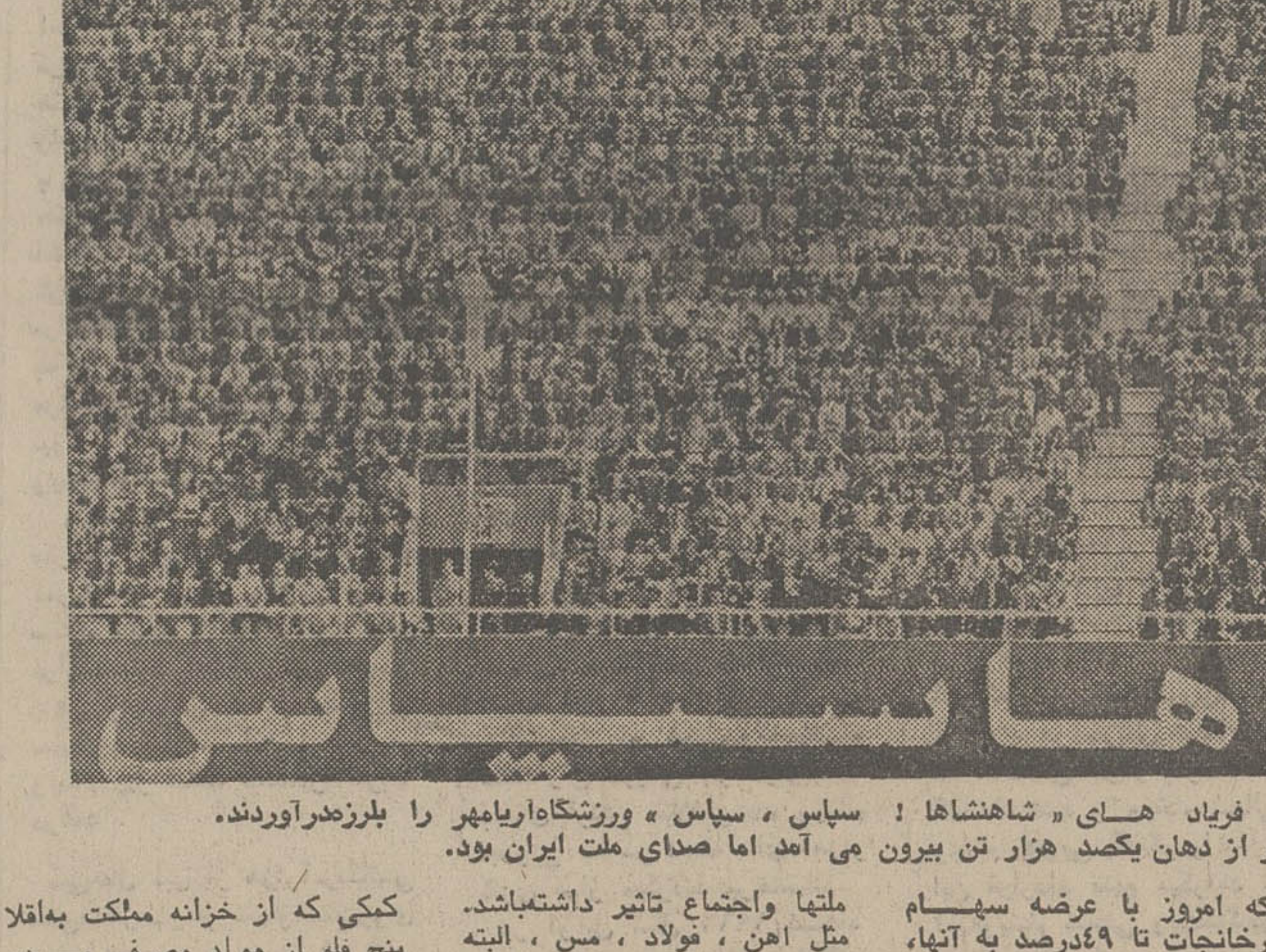
هویدا نخست وزیر و دبیر کل حزب رستاخیز ملت ایران دیروز در آئین سیاسی، گزارش شکل حزب یگانه واحساسات پرشور ملت ایران را بعرض رساند