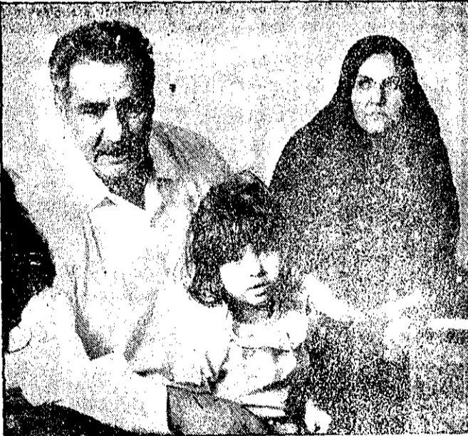
این عکس امروز از صفر قهرمانی قدیمی ترین زندانی سیاسی جهان که دیشب پس از ۳۰ سال آزاد شد گرفته شده است. صفر قهرمانی در اولین روز آزادی در کنار دختر و نوه اش نشسته است.

کارگران خارجی بجای کارگران اعتصابی ایرانی مشغول کار شدند