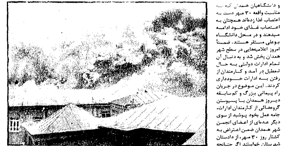
گر تظاهرات بعد از ظهر دیروز همدان، چند ساعت و ساختمان دولتی مورد حمله قرار گرفت و به آتش کشید شد. عکس، آتش سوزی در سینما لوکس همدان را نشان میدهد.

اسحاقی نژاد را تهدید بمرگ کردند تسهیریز- خیسرنکار کیهان- اسحاقی نژاد نماینده تسهیریز در مجلس شورای ملی به تلفظهای تهدید آمیز اعتراض کرد و گفت عوامل مخالف آزادی و سادات ملت ایران در برابر افشای حقایق بوخت افتادند و سازمانل به نیشات ناروا میسوزند روند بسبب قدرت آزادی‌های مردم ایران را صانع کردند اسحاقی نژاد گفت تلفظهای تهدید آمیزی که هرروز بسوزد من میشود همه اهل خانواده را نگران کرده است اما قافله که تهدید و احتمالاً کشتن من و اهل من قاصد نیست به آزادیهای ملت ایران آسیب نرساند