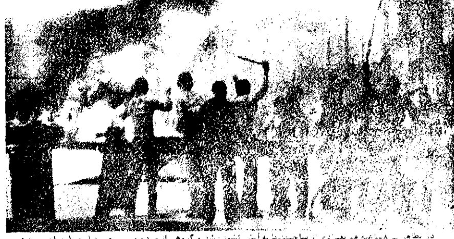
در تظاهرات ۸ بهمن تعدادی از دانشجویان به آتش کشیدند و گروهی از مردم و سربازان سوار بر تانک در جردن درخورد دیروز متوجه شدند.