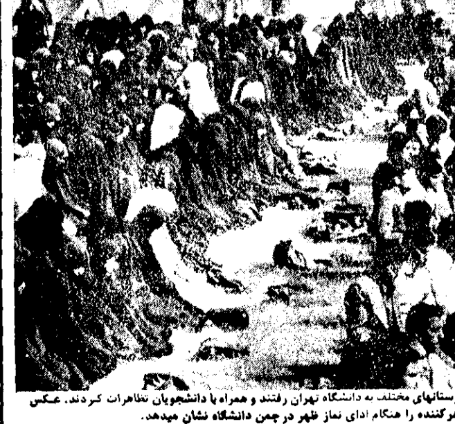
هزاران دانش آموز دیروز از دبیرستانهای مختلف به دانشگاه تهران رفتند و همراه با دانشجویان تظاهرات کردند. عکس دانشجویان و دانش آموزان تظاهر کننده را هنگام ادای نماز ظهر در چمن دانشگاه نشان میدهد.

آبادان - بدینال اعتصاب کشتیهای بندککش از شیخ کشتیهای خلیج فارس و بحرین به خارک آورده شدند و کارگران خارجی بجای کارگران اعتصابی ایرانی بکار مشغول شدند. اقیانوس بیما به اسکله بارگیری هستند.