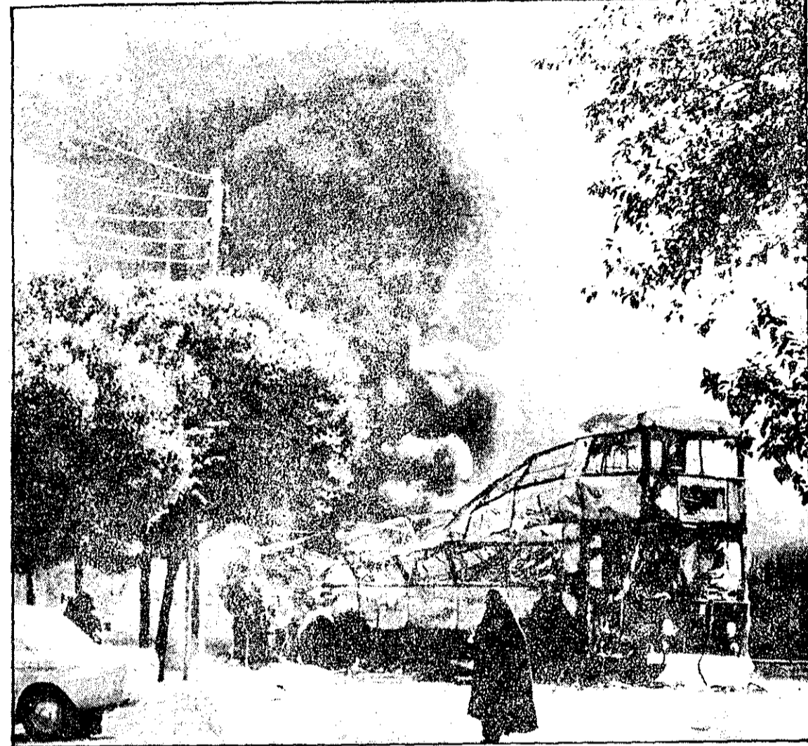
اتوبوس دوطبقه‌ای در شعله‌های آتش