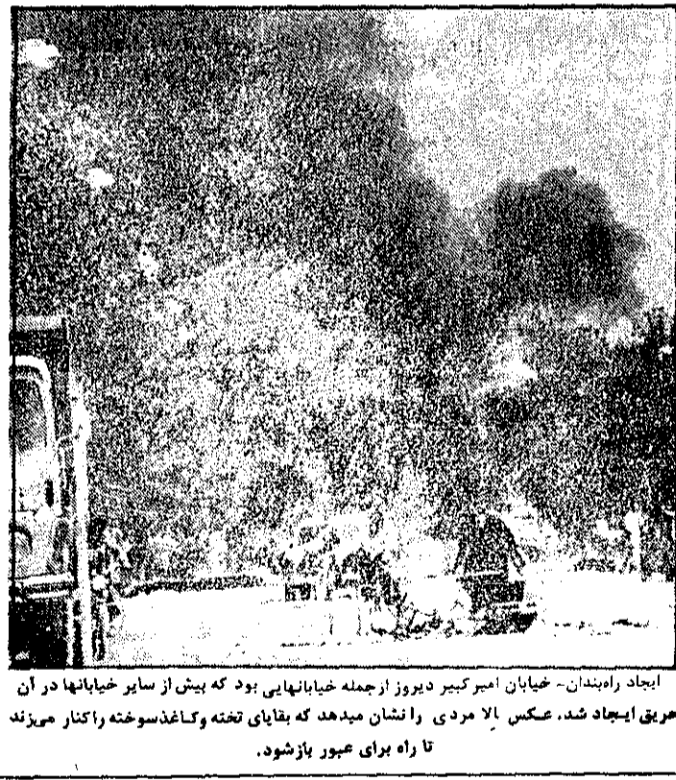
ایجاد رانندگان - خیابان امیرکبیر دیروز از جمله خیابانهایی بود که بیش از سایر خیابانها در آن حریق ایجاد شد. عکس بالا مردی را نشان میدهد که بقایای تخته و کاغذ سوخته را کنار می‌زند تا راه برای عبور باز شود.