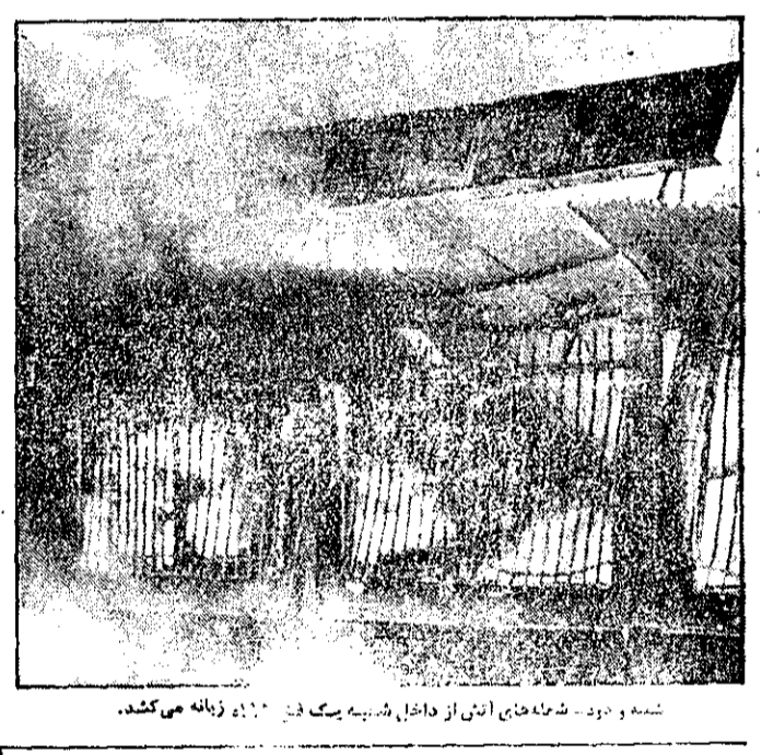
شبه و دود شعله‌های آتش از داخل شیشه یک فن ۱۲۰۰ زبانه می‌کشد.