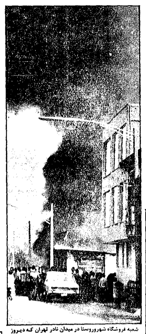
شعبه فروشگاه شهروستا در میدان نادر تهران که دیروز به آتش کشیده شد.