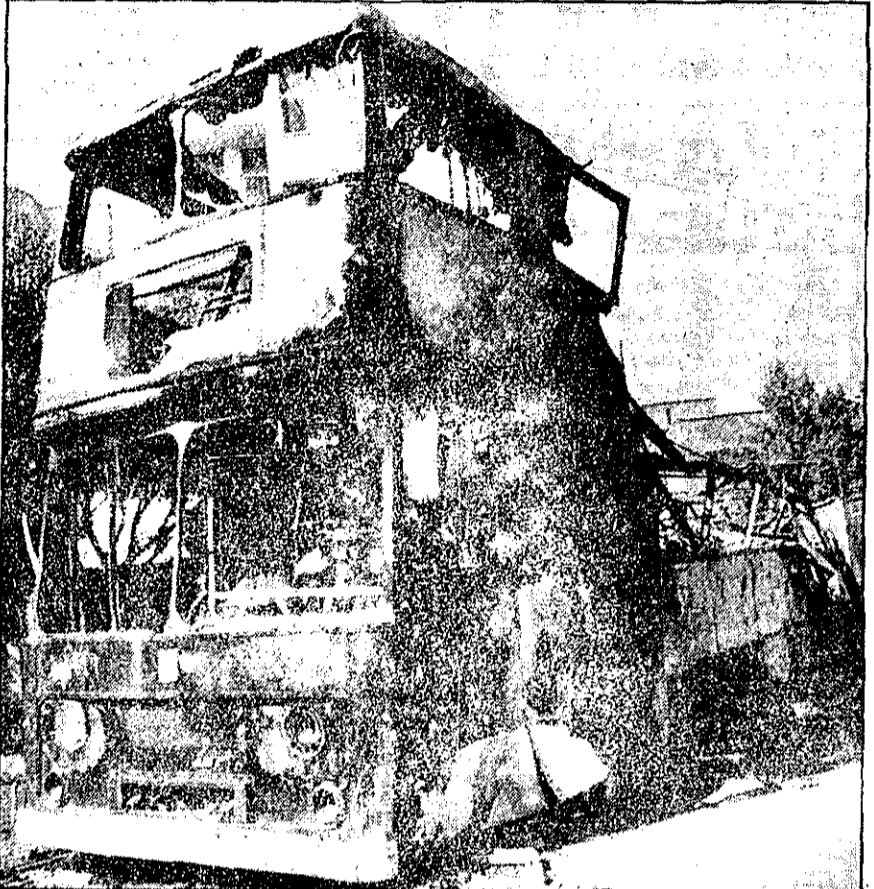
بقایای یک اتوبوس دوطبقه که دیروز آتش زده شد

ارتشبد اویسی، فرمانده نیروهای زمینی، فرمانده نظامی تهران و حومه شد دستور نخست وزیر برای انتشار کامل مذاکرات دو مجلس