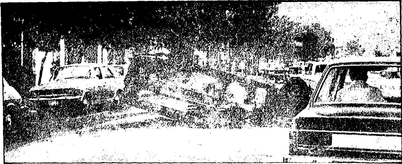
واژگون و سرنگ شدن این پیکان از انومبیلها پس از آنکه دیروز به آتش کشیده شد. رانندگان از کنار بقایای سوخته این اتومبیل میگردد.