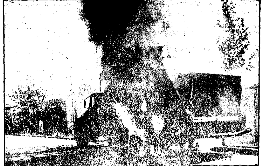
کامیون شهرداری در آتش شعله‌ور شد. آتش از داخل شیشه یک فن ۱۲۰۰ زبانه می‌کشد. خسارت غیر دیروز آتش رفته شد.