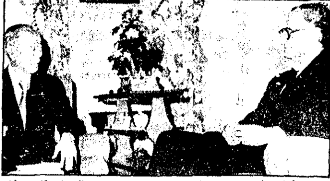
شاهنشاهی اریابهر ظهر روز پنجشنبه (پیرور) با کتوف کوه دستگیر زاین را در کاخ سعدآباد حضور پذیرفتند. (شرح خبر در صفحه آخر)

کیهان شنبه ۱۸ شهریور ۱۳۵۷ - ۶ شوال ۱۳۹۸ - شماره ۱۰۵۵۹