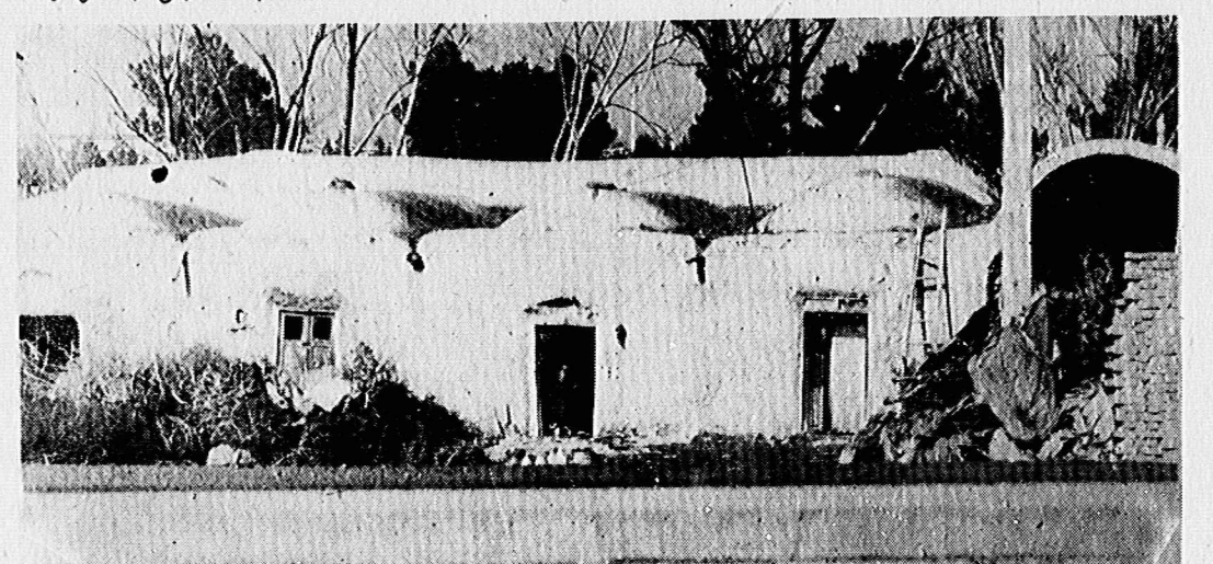
اینجا روستایی دورافتاده نیست، شهرکی است بنام ایرانشهر بل گوش تهران!

تهران آب آلوده سر کرده است. فارسی زبانان تاسیسات راهی خبری نیست. بهتر که بگویند ایرانشهر، جز فقر و مسکنت، هیچ چیز نیست.