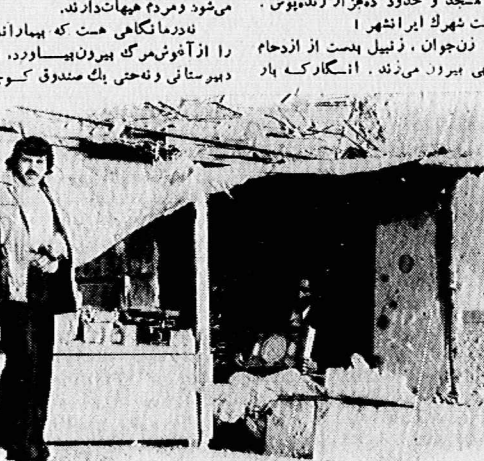
این بساط زندگی چند نفر را باید تأمین کند.

بنیادیت سارو زحمت رسول اکرم وفادات امام حسن مجتبی (ع) روزنامه مردم فردا منتشر نمیشود. بنیادیت سارو زحمت رسول اکرم وفادات امام حسن مجتبی (ع) روزنامه مردم فردا منتشر نمیشود.