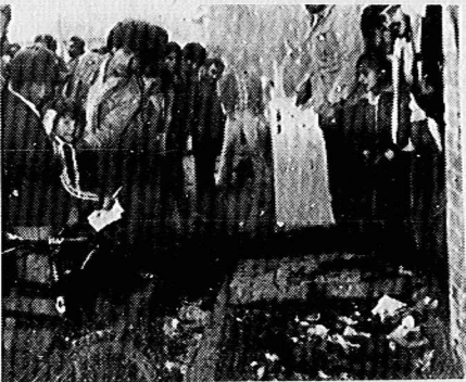
عوامل ضد انقلاب در روز ۹ دیماه به کیوسک فروش نشریات حزب توده ایران در گچساران حمله بردند و آن را به آتش کشیدند.

در بدایین عمل ضد انقلابی، نماینده فروش روزنامه مردم در گچساران، ضمن نامه‌ای به دادستان انقلاب اسلامی این شهرستان تا کیوسک خود را در گچساران به آتش کشیده و آن را به آتش کشیدند. نماینده فروش روزنامه این شهرستان تا کیوسک خود را در گچساران به آتش کشید و آن را به آتش کشیدند. نماینده فروش روزنامه این شهرستان تا کیوسک خود را در گچساران به آتش کشید و آن را به آتش کشیدند.