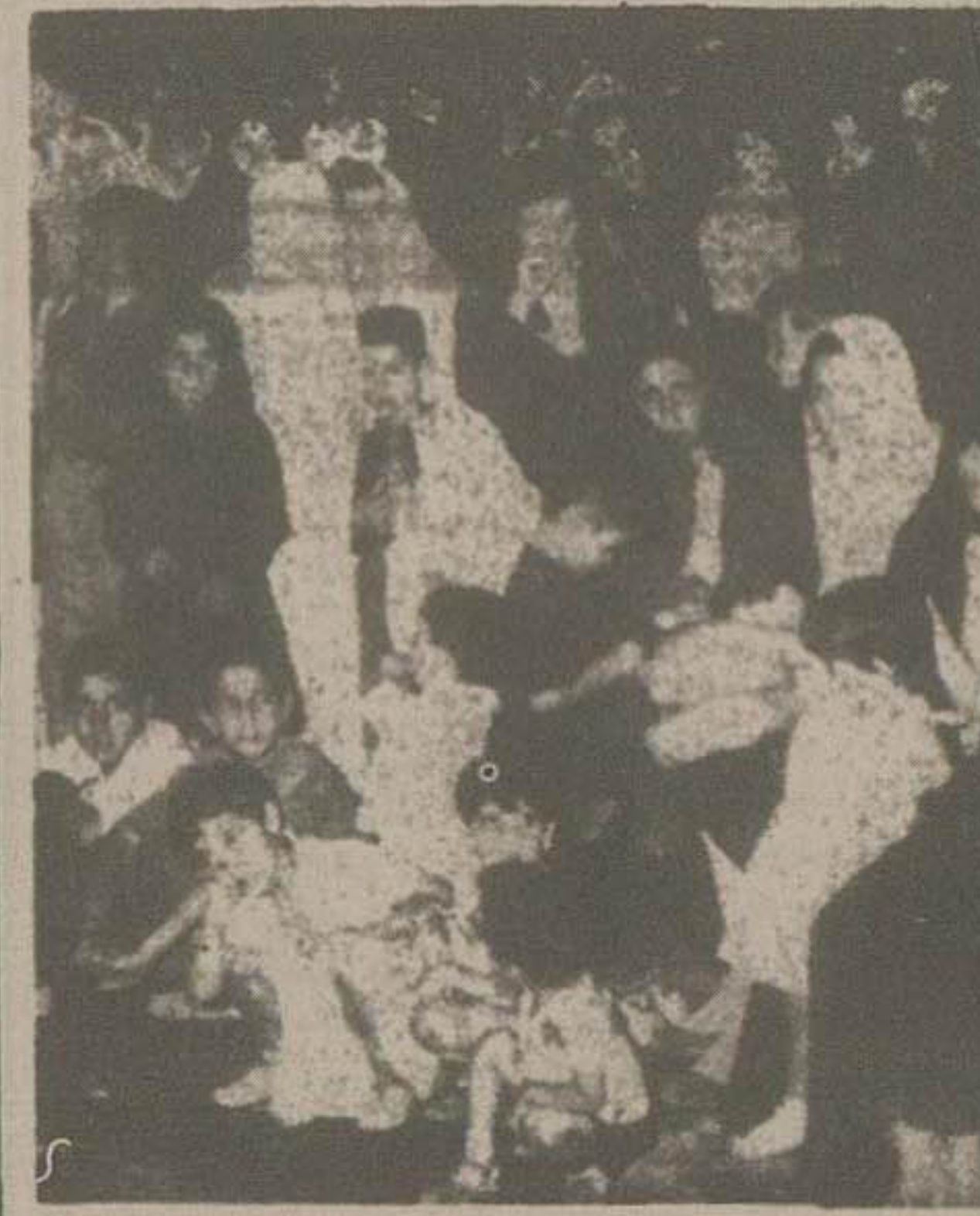
این عکس دولتی از مجالس جشن دیشب برداشته شده است و اجتماع زنان و کودکان را در این جشن نشان میدهد

در برزنها بعد از ظهر در روز دیشب در تمام برزنها ۲۰ گانه تهران بمناسبت ۲۸ مرداد مراسم باشکوهی برپا بود. بطوریکه خبرنگار ما گزارش داده در اغلب برزنها از طرف مردم و معزورین برزنها و مستعینین محلی پیرامون ۲۸ مرداد سخنرانی های مفصلی ایراد شد.