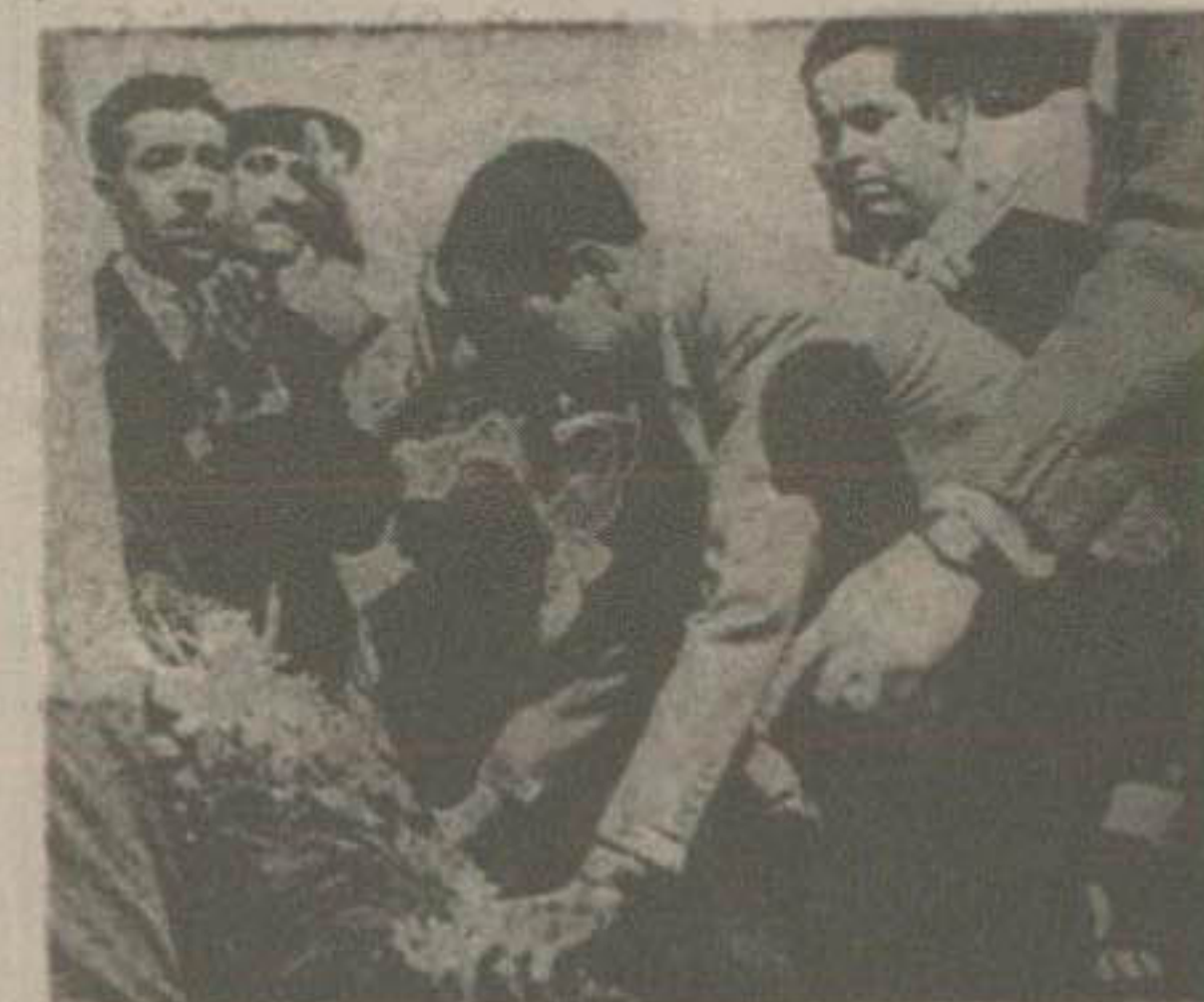
آقای علم دبیرکل حزب مردم و اعضای حزب هنگام تاج گل در پای میزبان

نیروزشکاران روزشبهای مختلف فرنگی مشغول بودند. بعد از ورود روزشکاران باشگاه جبری ۲۵ واحد ورزشی باشگاه های کادری وارد خیابان شاه آباد گردیدند اینها مرکب از روزشکاران راه آهن، خانینات سیلو سیمان، برق نصرخانه، آجرنوسر، شیمیایی گلپیرین، چیت سازی، بیسی کولا، چت ساز، وند و زمین بودند.