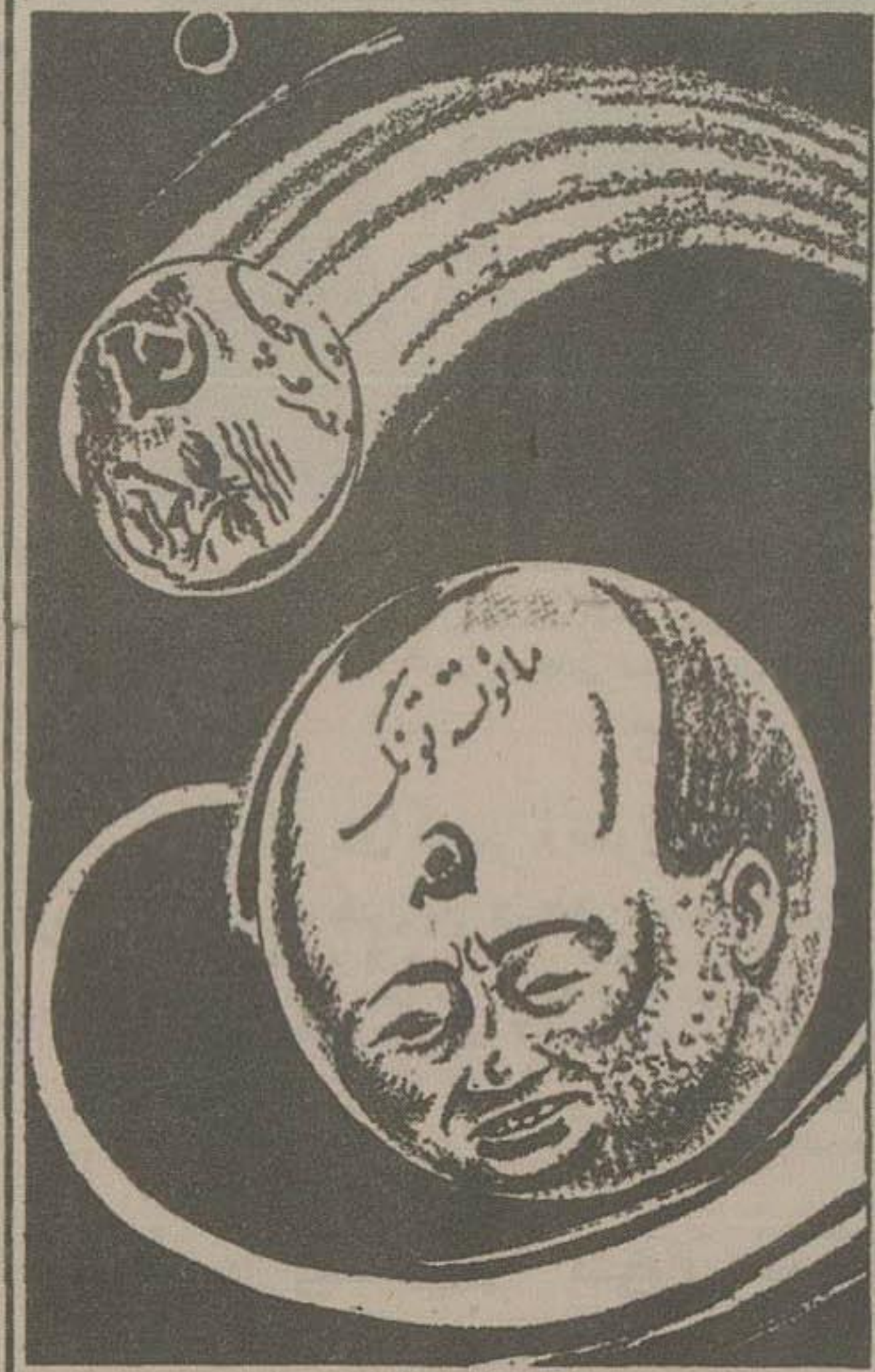
کدامیک فکر دیگری است؟

وزیر خارجه جدید چین حمله اقتصادی و دیپلماتیک سختی را در دهه جبهه شروع کرده چین کمونیست اخیراً در سیاست دیپلماتیک و اقتصادی خود تغییراتی را انجام داده است. وزیر خارجه جدید، چیو چو، در دیدارهای خود با رهبران کشورهای دیگر، بر توسعه روابط اقتصادی و سیاسی تأکید کرده است. این تغییرات نشان می دهد که چین از سیاست انزوای گذشته خسته شده و به دنبال گسترش روابط خود با جهان است.