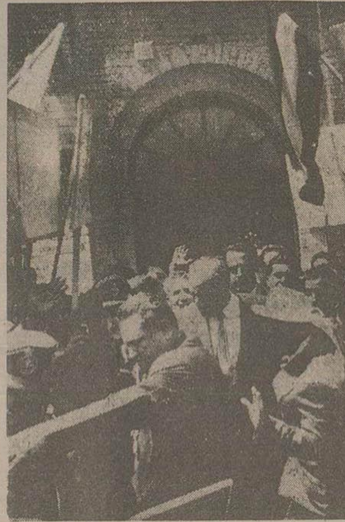
نخست وزیر در میان ازدحام فوق العاده جمعیت محل رژه را از میدان ۲۸ مرداد ترک می نمایند

دیشب و امروز به مناسبت قیام ملی ۲۸ مرداد مراسم جالب و باشکوهی از طرف احزاب و طبقات مختلف پایتخت برگزار شد و جشنهای متعددی برپا گردید. بهمناسبت قیام ملی ۲۸ مرداد مراسم جالب و باشکوهی از طرف احزاب و طبقات مختلف پایتخت برگزار شد و جشنهای متعددی برپا گردید. بهمناسبت قیام ملی ۲۸ مرداد مراسم جالب و باشکوهی از طرف احزاب و طبقات مختلف پایتخت برگزار شد و جشنهای متعددی برپا گردید.