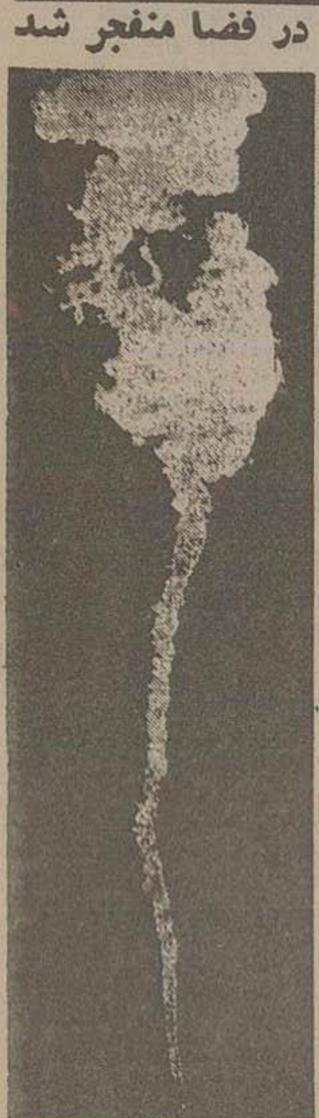
موشک «اورن ایل» آمریکا که قرار بود بهایه پرتاب شود در فضا منفجر شد

در اینفوته رژه دستجات مختلف حزب ملیون از برابر شمال شاهنشاه که در بالای عمارت شرقی میدان قرار داشت آغاز شد. در مراسم رژه مزبور آقای دکتر آقبال نخست وزیر و رهبر حزب ملیون و چندتن از آقایان وزراء حضور داشتند. آقای دکتر آقبال از ساعت ۹ و نیم میدان ۲۸ مرداد آمده بود. در تمام مدت رژه مأمورین انتظامی حزب نظم معوهه میدان ۲۸ مرداد بقیه در صفحه سیزدهم