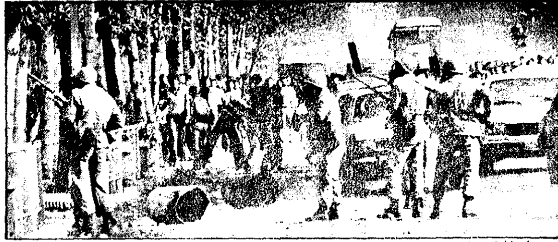
در اوج خشونت و تظاهرات، انبوه تظاهرکنندگان با پرتاب سنگ به مأموران پرداخته‌اند. مأموران نظامی، دانشجویان و دانش‌آموزانی را که مقابل دانشگاه اجتماع کرده‌اند بمقرب می‌رانند.