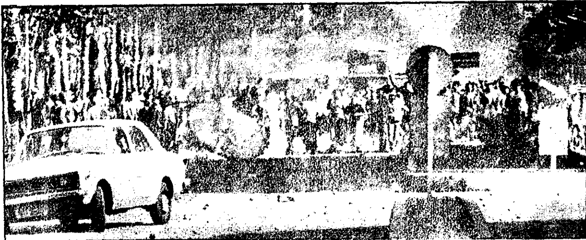
تظاهر کنندگان در مقابل دانشگاه تهران با پرتاب سنگ به مأموران نظامی و دانش‌آموزانی را که در برابر مأموران نظامی به مقابله پرداخته‌اند.