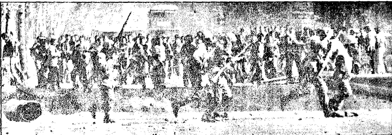
مأموران نظامی، با ستابریان تظاهر کنندگان روزیرو شهانند و از صحنه تظاهرات دور می شوند

در تظاهرات خشونت آمیز دیروز ۳۰ نقطه تهران به آتش کشیده شد • برای اعتراض به برقراری سانسور مجدد: مدیر عامل قلویریون استعفا کرد وزیر آموزش و پرورش هم از کابینه کنار رفت