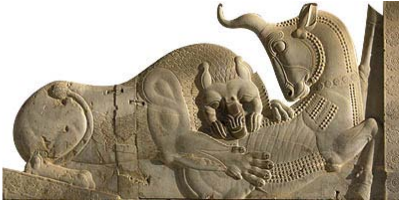
نگاره ی تخت جمشید

در پیکره ی گنج خانه ی واتیکان هم، آن مرد جوانی که زانوی خود را بر پشت گاو فشرده و دشنه را در گردنش فرو برده است همان بغ مهر ، یا خورشید است.