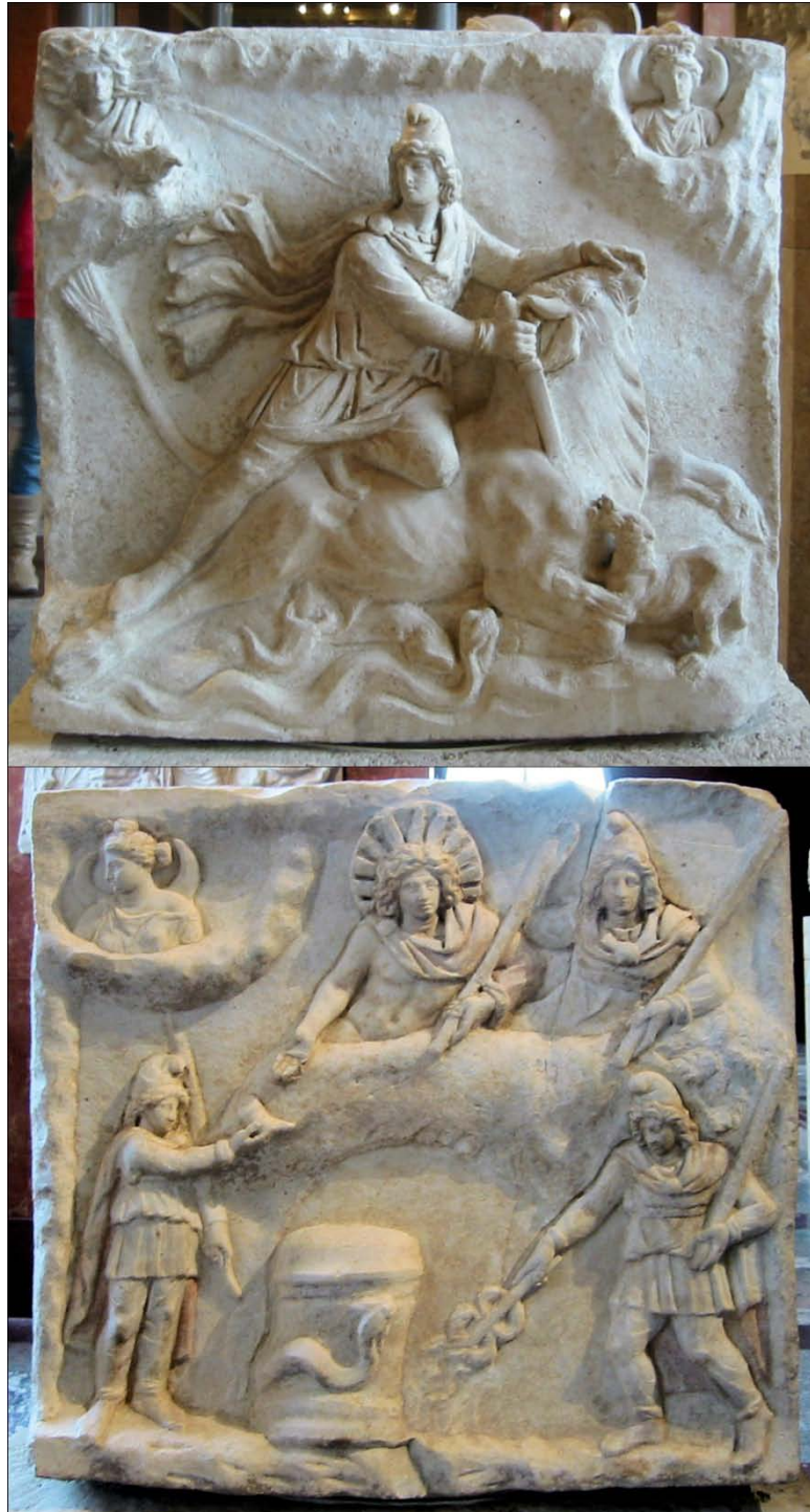
نگاره های دیگری از مهر در بارورکردن زمین