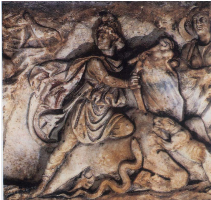
مهر - گاو (یا خورشید و زمین)

در پیکره ی گنج خانه ی واتیکان هم، آن مرد جوانی که زانوی خود را بر پشت گاو فشرده و دشنه را در گردنش فرو برده است همان بغ مهر ، یا خورشید است.