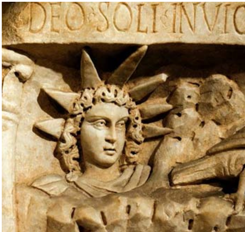
نگاره ی دیگر از مهر

یکی از آیینهای جشن یلدا پاره کردن انار است، چه پیوندی میان انار و خورشید است؟ آیا پوست کلفت انار نماینده همان سنگ مرمر در درون گاباه نیست؟ آیا دانه های سرخ انار همان سرخی آسمان پیش از فرا شد خورشید و بهنگان فرو شد خورشید نیست؟ آیا این همان سرخ نیست که رنگ جامه ی کاردینالها شده است؟ آیا میان این (سرخ) و (عقل سرخ) سهروردی پیوندی در میان نیست؟