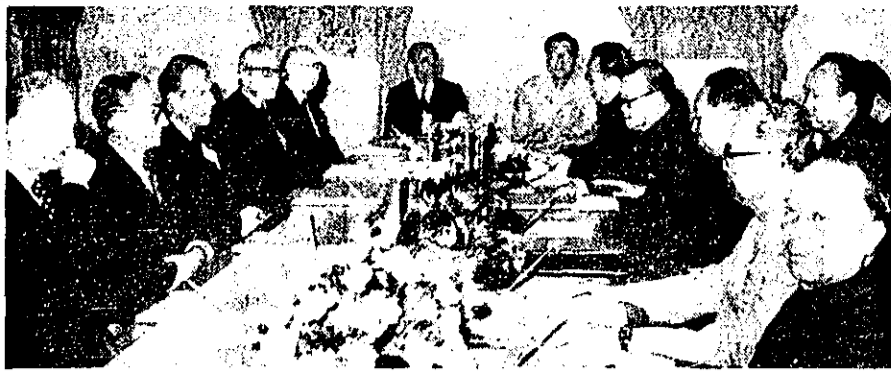
مذاکرات رهبران ایران و چین نخستین دور مذاکرات رهبران ایران و چین روز گذشته در کاخ سعدآباد برگزار شد. در این مذاکرات هیات‌های نمایندگی دو کشور شرکت داشتند.

رادیولندن: اگر راه‌های سیاسی به نتیجه نرسد