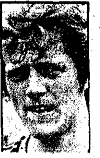
آقایان ... دومین گل هلدرا ... برای ...

هلند و آرژانتین برای تصاحب جام جهانی فوتبال انتخاب شدند