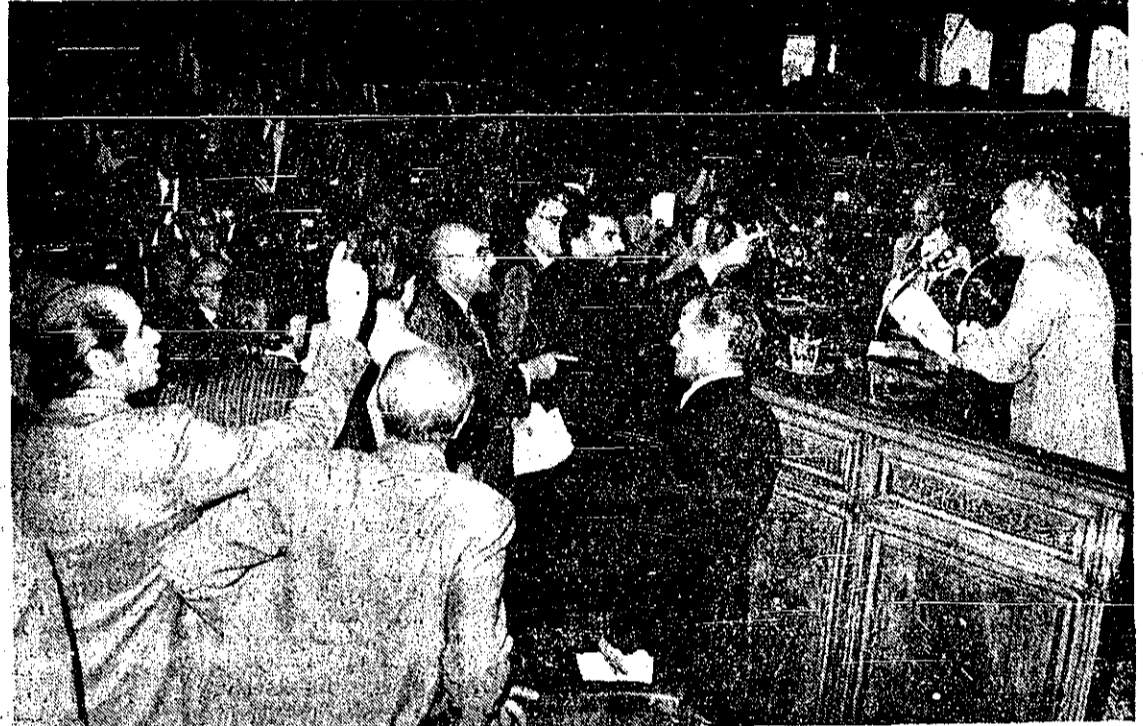
هنگام نطق بزشکیور جلسه امروز مجلس بارها متشنج شد و رئیس و عده‌ای از نمایندگان جلسه را ترک کردند. در عکس چندین از نمایندگان خطاب به بزشکیور فریاد می‌زنند و او را دعوت به ترک تریبون می‌کنند.

نمایندگان خطاب به بزشکیور فریاد می‌زدند: فاشیست.. آفاشیست.. «پان ایرانیست» مرد مجلس پارسا : در ۲۶ مرداد حزب پان ایرانیست با همکاری جبهه ملی در بو ابرسو باز خانه خرم آباد تظاهرات براه انداخت سخنان جنجال انگیز بزشکیور مجلس را از رسمیت انداخت