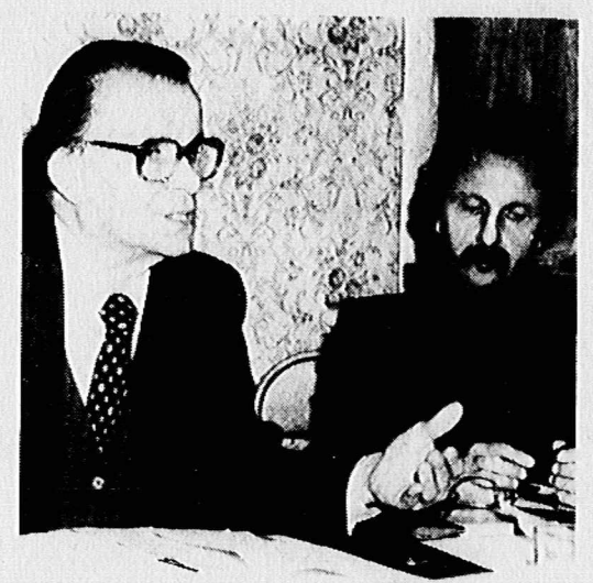
آذین درجای دیگر گفت: درباری نمی‌توان دانست که این...