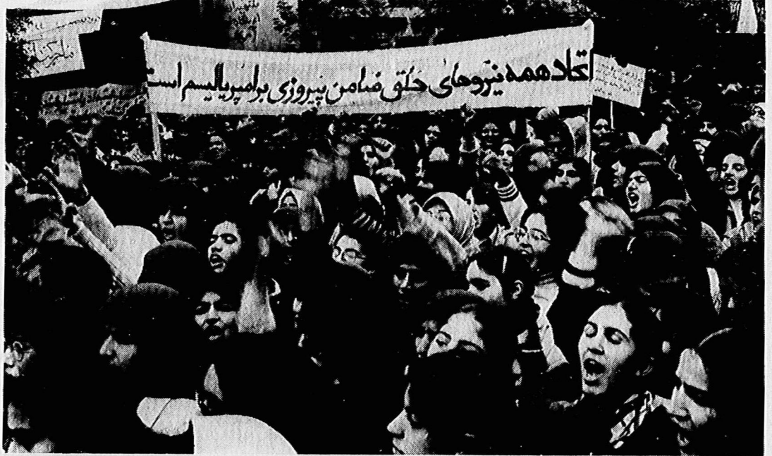
این گوشه‌ای از لشکر زنان است. آنها مثل همه خلق یک شعار دارند: همک بر آمریکا!

مردم تبریز در تظاهرات باشکوه ضد آمریکائی شرکت کردند.