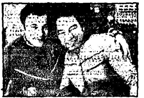
یوری رومانووکو گورگن گرچکو، دو فضاپرواز شوری برای یک عکس سیاه کاری در ایستگاه فضایی سالیوت-۶ یکدیگر را در آغوش می‌نشانند. این عکس دیروز در زمانی برداشته شده که آن دو رکورد اقامت در فضا را شکستند.