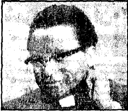
اسقفیل موزوروا در لندن

اسلام‌آباد - فیروز گزاری فرانسوی بر پدیده‌های رئیس جمهوری افغانستان امروز برای دیدار رسمی چهار روزی وارد پاکستان می‌شود. پدیده‌ها داود در این دیدار صد گزینی است و زوار مستعد ضمانت، مقرر نظامی پاکستان فرمانده عالی منطقه و موضوعات بین‌المللی بعمل خواهد آرد.