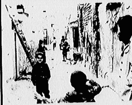
گزارشی از زندگی سراسر محرومیت گروهی از هوطنان ما، در قلب پایتخت...