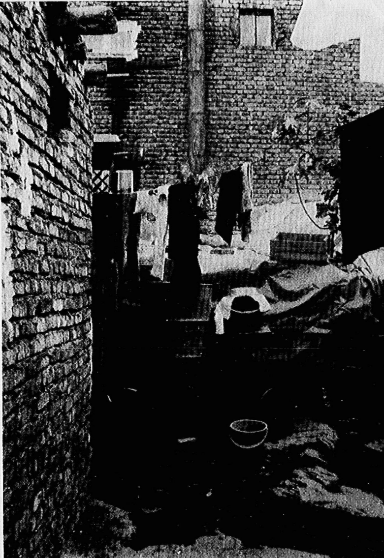
این بزرگترین خانه (!) محله است. محله‌ای که حتی نام هم ندارد. کوچه بیرونک پشت بشکه آب، اتاق است نه زباله!

زندگی می‌کنیم اما اگر نداند. معلوم نیست چه بلایی سرم بود. زنی دیگری است که سخن می‌گوید