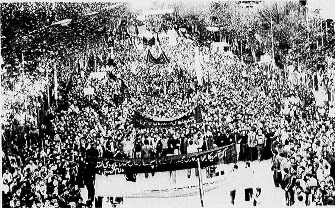
مردم در روزهای تاسوعا و عاشورا برای ادامه مبارزه علیه امپریالیسم آمریکا تجدید پیمان کردند...