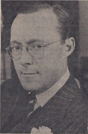
● والاحضرت پرنس برنارد، همسر علیاحضرت ملکه هلند