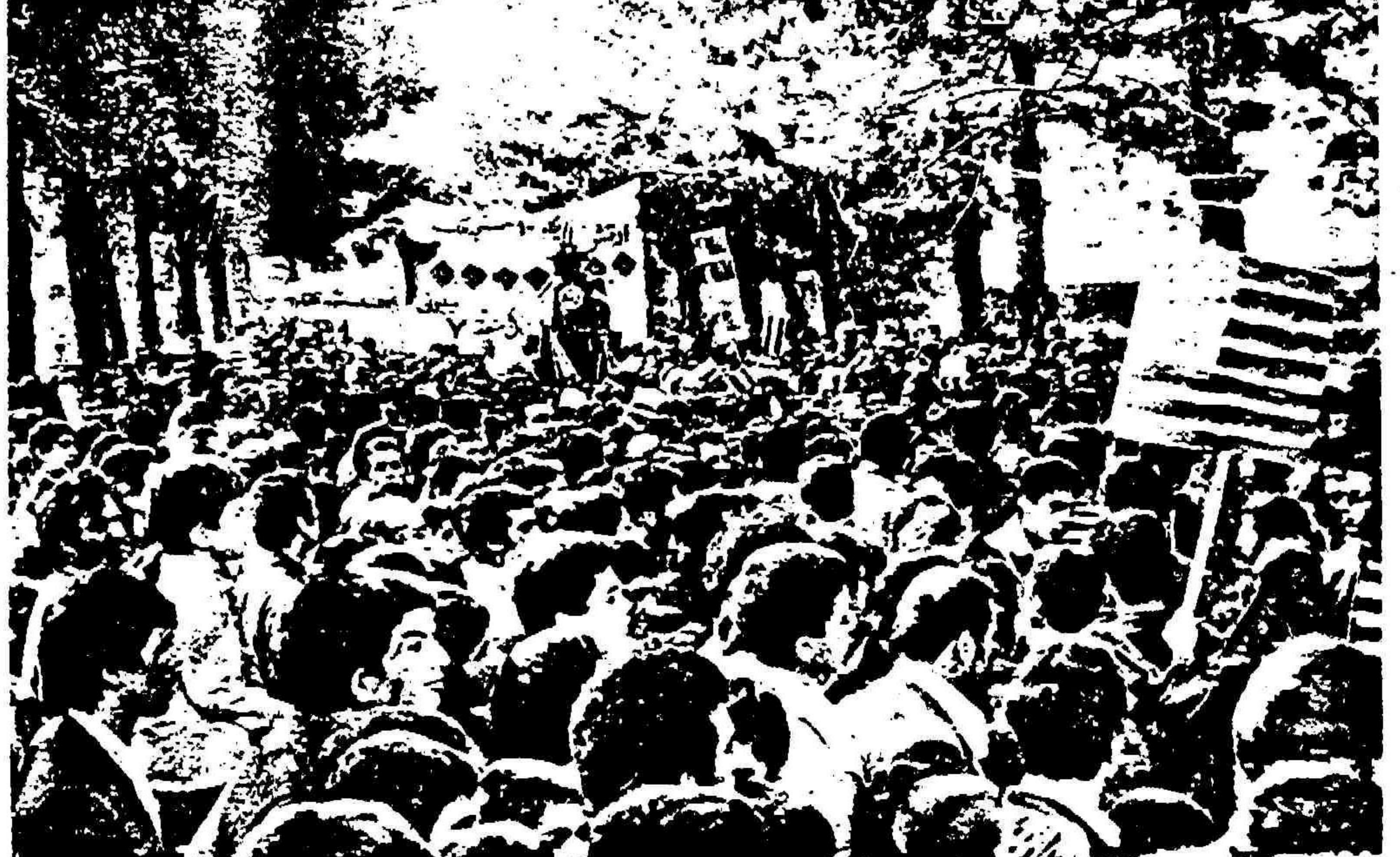
موجی از دریای توفان خلق. اینجا داخل لانه جاسوسی است. بچه های باغچه آباد رنگان را مهار زده اند و می آورند.

اتحاد انقلابی خلقهای ایران و عراق بر ضد امریکایکاور رژیم صدام