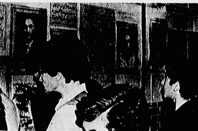
گوشه‌ای از نمایشگاه به‌یاد شهیدان راه آزادی و استقلال ایران

میهن‌پرستان و آزادخواهان ایران و به‌ویژه از بازماندگان و دوستان همه شهیدان خواستاریم که عکس و اطلاعات مربوط به‌زندگی و بیکار و شهادت شهیدان غیر توده‌ای را نیز در اختیار اداره کنندگان نمایشگاه و یا دفتر «مردم» قرار دهند. موجب سپاس فراوان خواهد شد.