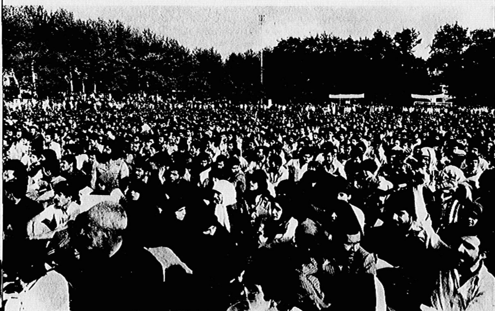
صحنه‌ای از مراسم سالروز اشغال فلسطین

ساعت ۳:۳۵ بعد از ظهر روز ۲۶ اردیبهشت، اجتماع پرشکوهی با شرکت ده‌ها هزار نفر، در محوطه چمن زمین ورزش دانشگاه تهران، به‌مناسبت ۱۵ ماه مه، سالروز اشغال فلسطین برگزار شد. طی این مراسم که با