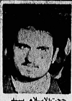
حجت الاسلام سید حسین خمینی

۲ میک متجاوز عراق مناطق مسکونی «نودشه» و «نوسود» را بمباران کردند در صفحات ۱۵ و ۱۶