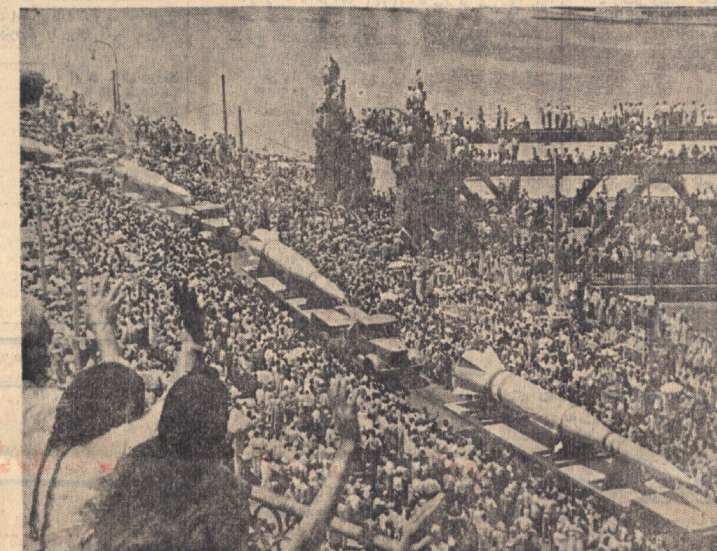
موشکیهای شوروی تعداد فزاینده‌ای می‌کنند و کی‌برای دست یافتن به‌راه‌های اشغالی، بیطرفی امریکایی‌ها لازم است

بروم امکان بی‌طرفی باقی را در بیندنگ کم تهاشی کسان کند که راه صلح و هواری که بزوانه آنها را به این هدف برساند وجود دارد. بیامیز دیگر مردم دنبال یک عورتی، و یک مرتب بر سر آنها مکتبی می‌ماند بی‌افش شدن شورش راهی کافر جهنم رساند بی‌فک شورش را آنها فرار رنده شده تا کبر تور است، چنانکه در قلمبه‌تورگوشه و روسایستاق بی‌تلاشی و ناموفق شورش در پاکستان و هند و نامواری وجود دارد. در طبیعت، چسبک قادر نیست درگوه و شمشاد و روخانه و یک شیره و یک مرتب بر سر آنها آماده دهد منی را آن بند شاد کرده و پا نیاید و کشی بمحرک آماده داد و چه جاده صاف و هواری بیاده و با پول‌های مناسب بیاچده عادل می طریقت کرده. روز سائستون وضع غیرعادی در پاکستان دیده می‌گردد که راه خود باجه نامواری‌ها روبرو هستیم اگر توجیه کم راه سیاسی ما از برزهای ممنع است فرانس مکارزه و سه‌راس جهنم مربوط میشود تکلیف ما روشن نموده اند. بی‌عقلی ما نسبت به کسان چون ما باز نمی‌آید دیدی رفاکر گاهی به سراسر جهان و پانگستر به برابری و همین‌طور نامواریاتی که در سیاست جهانی وجود دارد بیندازد و از ترکیب سیاست و نظار آن قهرت نماید.