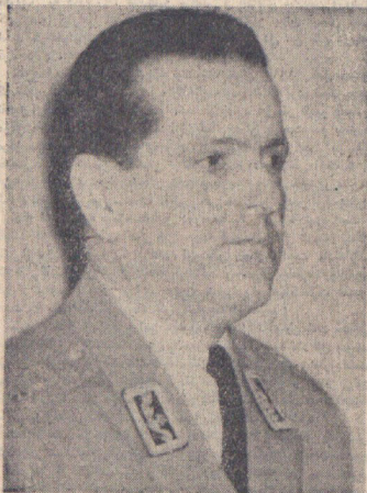
تیمسار سرلشکر فرسیو

سرلشکر فرسیو مورد اصابت چند گلوله قرار گرفت و به بیمارستان منتقل شد