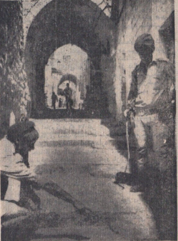
یک سرباز اسرائیلی محلی را که بر اثر پرتاب یک نارنجک توسط جریکهای عرب ویران شده نشان میدهد. بر اثر انفجار این نارنجک گروهی از مردم و از جمله توریست های آمریکائی مجروح شدند و یک نفر کشته شد.