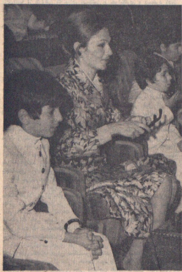
علاحضرت شهبانو برنامه های جشن بایان سال تحصیلی هنرستان ملی باه را که بعد از ظهر دیروز در تالار وزارت فرهنگ و هنر اجرا شد، مشاهده میفرمایند. والا حضرت ولیعهد و الا حضرت علیرضا در طرفین شهبانو نشسته اند و والا گهر همراز نیز در عکس دیده میشود. در صفحه ۴