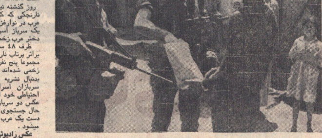
روز گذشته نیز پرویز سراسر مرز بین پاکستان شرقی و هند را بستند تا مانع از ورود آوارگان پاکستانی گنگامال ویا هشته وارد هند نشوند...