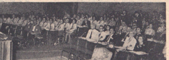
دکتر محمد صالح وزیر اطلاعات در جلسه کنفرانس سازمانها و جمعیت های تحت ریاست طبعاخص تحت رهبری شهسواران درباری

کترانی سازمانها و جمعیت های تحت ریاست طبعاخص تحت رهبری شهسواران درباری گفتند که در این جلسه طیف وسیعی از مدیران دولتی و سازمانها گردیدند و این جلسه به منظور آشنایی مدیران دولتی و سازمانها با اصول و روشهای صحیح مدیریت در این جلسه برگزار گردید. دکتر صالح در این جلسه بر اهمیت اجرای اصول صحیح مدیریت در سازمانها تأکید کرد و گفت که مدیران باید با استفاده از این اصول بتوانند کارهای خود را به بهترین وجه انجام دهند.