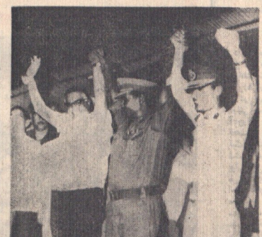
کودتای که روز دوشنبه گذشته انجام آرام چتر لیبی را از سر کسب قدرت بر سر هنگ قذافی بر سر هنگ قذافی...

روز دوشنبه نخستین صدای که مردم سودان از داد و ستد متعلق به رژیم هنگ قذافی است، آکس ۱۹۶۴ و انفابان آفراسی به سال ۱۹۶۹، صمت پاکر شدم است. از در کودتای ۱۹۶۹ رژیم زرارل بود نوسا غیر نظامیان سودان و در انفابان ۶۴ به ۱۹۶۹، کودتای ۶۴ به رهبری نوبیسر کومیت غیر نظامیان را از کار بر کنار کرده است. سر هنگ لئور سرگرمدهامه و سر سکر صانز رهبرانی بودند که کودتای ۶۴ را شکست دادند. با کودتای ۶۴ لئور لیبی کومیت سودان را تشکیل دادند و در آن کتیز هم بود. نوبیسر یاری کومیت‌ها می‌بودند. نوبیسر یاری کومیت‌ها می‌بودند. نوبیسر یاری کومیت‌ها می‌بودند.