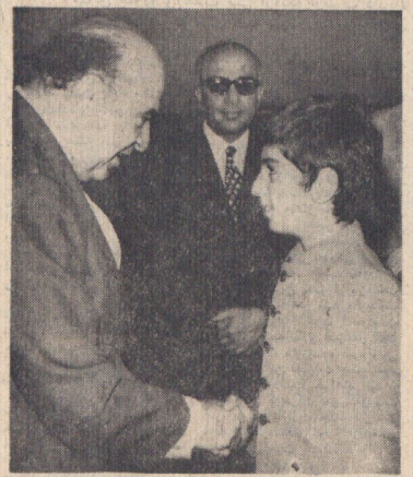
والاحضرت ولیعهد و والاحضرتیادروز از سفر سوئیس به تهران بازگشتند مورد استقبال آقای نخست وزیر و شخصیت های مملکتی قرار گرفتند در عکس آقای هویدا نخست وزیر هنگام استقبال از والاحضرت ولیعهد دیده میشوند . شرح در صفحه ۴

سیل بجنورد ۲۰۰ خانه را ویران و ۱۰۰۰۰ نفر رایخانمان کرد در صفحه ۴