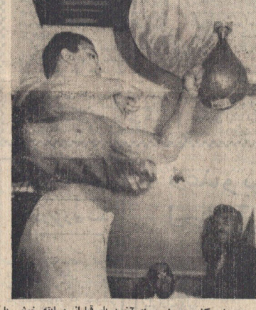
محمد علی کلی در روز برای آخرین بار قبل از مسابقه خود با (جیمی الیس) با کاسه تصویر کرد . عکس یادگاری اطلاعات گوشناسان ورزشی مسابقه امشب کلی و جیمی الیس را بیک قهار بزرگ برای آینده کلی میلانند . در صفحه ۲

هواپیماهای لیبی سربازان سودان را از مصر به حومه خرطوم نقل کردند این سربازان بلافاصله پایتخت سودان را مورد حمله قرار دادند و کودتاچیان را شکست دادند نومیری گفت : عراق مستقیماً در کودتا دست داشت ۱۰۰۰ نفر از کمونیستهای سودان دستگیر شدند بدنیال اعلام سرگرد عثمان تکلیف سرهنگ «النور» هنوز روشن نشده است در صفحات ۲ و ۶