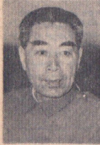
هوشیار نخست وزیر چین بروزی از ایران دیدن میکند ؟

ایران و چین - کهو نیست موافقت کردند هر چه زودتر سفیر مبادله کنند صفحه ۴ آگهی پذیرش دانشجو برای دوره لیسانس مدرسه عالی