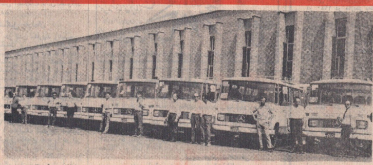
عکس بالا ، پیش از عزیمت کاروان برداشته شده و روانه گمان رومانی را درکنار محصولات صادراتی ایران ناسیونال نشان میدهد

ککشور رومانی از محصولات ایران ناسیونال خریداری می کند. باری اول از ۱۷۰ دستگاه کند. باری اول از ۱۷۰ دستگاه