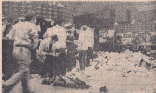
بروزی بلطاعیسان از اعلامیه تصمیمات جدید پولی آمریکا از طرف پروژنت نیکسون بورس نیویورک با بورش بیسابقه فازندگان دلار روپوش شد . هر این عکس که لحظه ای سازمان شهن بورس گرفته شده و متنگان اوراق باطله را نیز می بیند

* سفیر اقتصادی ایران در آمریکا : محدودیت های وارداتی آمریکا بضرر ایران است بانک مرکزی امروز بجز دلار قیمت سایر ارزها را اعلام نکرد در صفحات ۱۳ و ۱۵