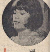
کلدا جورج اسکاٹ بخاطر بازی در فیلم ژنرال پاتون و گلندا جاکسون بخاطر بازی در فیلم زن عاشق بعنوان هنرپیشگان اول مرد و زن سال انتخاب شدند

جورج اسکاٹ اعلام کرد که حاضر نیست جایزه اسکار را دریافت کند در صفحه ۳