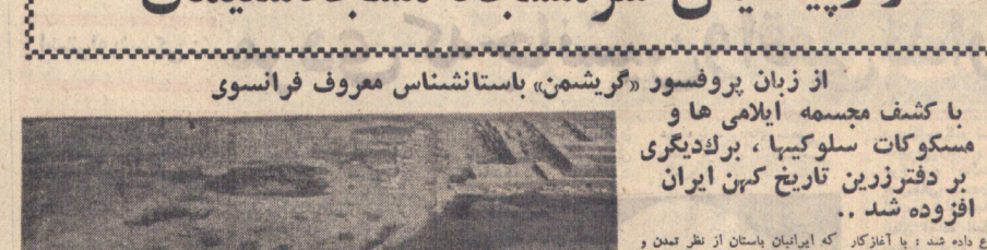
راز پیدایش «سر مسجد» مسجد سلیمان