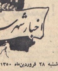
صفحه ۸ - اطلاعات

بازمانده مایه و ساختههای شده در سرسبز ۴ مسجلمین برارند.