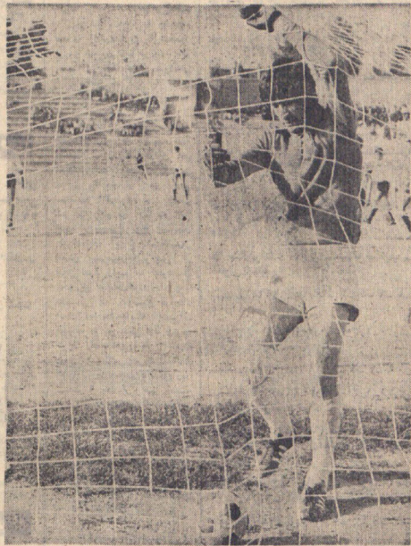
جزئی دروازه بان تاج در نیمه در دقیقه ۸۰ از روی نقطه پانته بیگ گل از دست داد ، او بعد از تانتالی از دسترفته درحال برداشتن توپ از داخل دروازه دیده می شود .

دیدار بزرگ عقاب و پاس که ۱-۱ مساوی پایان رسید ، پاس را به اولین نتیجه مساوی واژ دست دادن پاک امتیاز طول هفت بازی مجبور کرد و در این زمان پیش از هرچیز نتیجه این دیدار مساوی پرسپولیس میباشد که با نتیجه مساوی بدون گل مقابل راه آهن سخت از جانب پاس تهدید میشد . ولی دیدار پلیدی این روز را دو تیم کاروبری ارائه کردند که کار در سایه درخشش داود میرطوسی صاحب تنهاکل بازی و در نتیجه پشمین پیروزی خودگردید و این پنج پیروزی همراه با نتیجه مساوی مجموعاً گارد را با ۱۳ امتیاز در کنار عقاب بجای سوم میرساند . چیزی که برای یک تیم جوان سخت امیدبخش است . ولی حادثه مهم هشتمین روز، بدست آمدن سه ضربه پانته بیگ مقابل پاس بود که پانته آن تیمهای اسفر و آزارات به پیروزی رسیدند و تیم دبیوم نوانست دیداری پرتلاش و اسبیل دروازه تیم همراوه خود تاج را فتح کند .