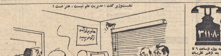
نخست وزیر گفت: مدیریت علم نیست، هنر است!

نخست وزیر گفت: مدیریت علم نیست، هنر است! نقیضت وزیر گفت: مدیریت علم نیست، هنر است!