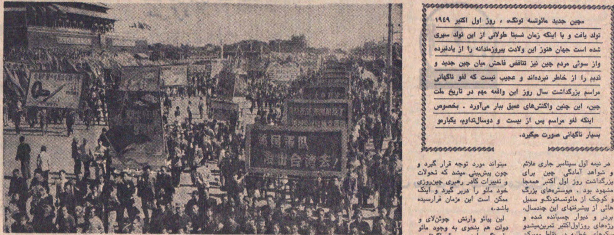
یک صحنه از تظاهرات طلبکاران در شهر گوانگ‌ژو، چین. در این تصویر، توده‌های عظیمی از مردم در خیابان‌ها و میدان‌ها گرد آمده‌اند. در پس‌زمینه، ساختمان‌های دولتی و نمادهای حکومتی دیده می‌شود. این تظاهرات بخشی از جنبش‌های اجتماعی و سیاسی در چین است که به دنبال اصلاحات و آزادی‌های بیشتر است.

میانگین جدید ماهانه تورنگه - روز اول اکتبر ۱۹۸۹ تورنگه و تانگ و این زمان نسبتاً طولانی از این توله سوری شده است. جهان هنوز این واکنش‌ها را در یاد دارد و این واکنش‌ها را از یاد هرگز فراموش نمی‌کند. این واکنش‌ها نشان می‌دهد که مردم چین به دنبال آزادی‌های بیشتر و دموکراسی است. این واکنش‌ها همچنین نشان می‌دهد که مردم چین به دنبال تغییرات اساسی در ساختار سیاسی و اقتصادی است. این واکنش‌ها همچنین نشان می‌دهد که مردم چین به دنبال آزادی‌های بیشتر و دموکراسی است.