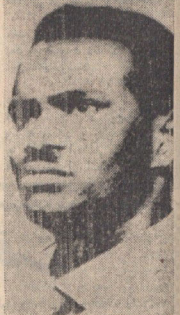
سرگرد هاشم عطا رهبر کودتای سودان

یک سرگرد کمونیست قدرت را در سودان بدست گرفت