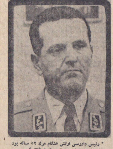
* رئیس دادوسی ارتش هنگام مرگ ۵۲ ساله بود در صفحه ۴