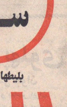
اصناف و مردم برای مراسم نیایش تدارک می بینند