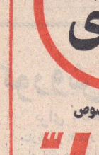
اسوبودا رئیس جمهوری جکسلاوی نیز در جشن شاهنشاهی شرکت میکنند