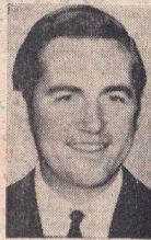
اعلیحضرت کنستانتین پادشاه یونان