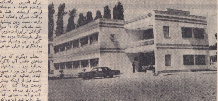
دو سال پیش در این ساختمان بود که رضاشاه آرمنا در التزام خود با ایران و رضاشاه کبیر در التزام خود با ترکیه امضاء کردند.

سال ۱۳۱۳ در التزام علیحضرت رضاشاه کبیر به ترکیه سال ۱۳۵۰ در التزام شاهنشاه آرمنا به ترکیه