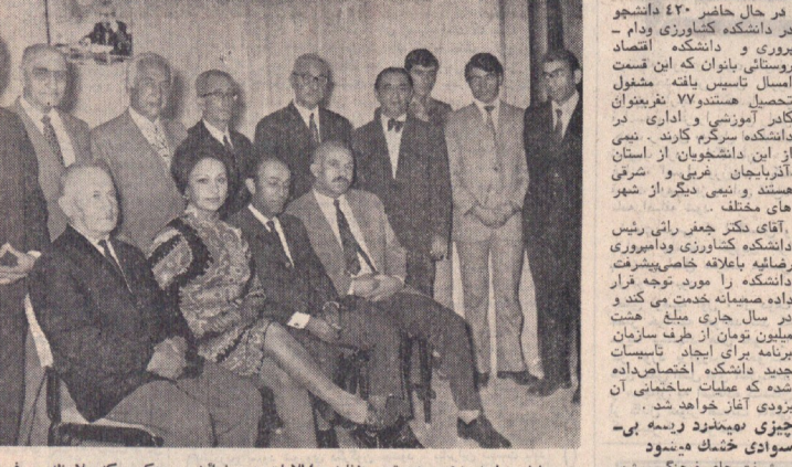
این گروه از افراد در سال ۱۳۱۳ در التزام خود با ایران امضاء کردند.

ما سخن شهری که در ۲۷ سال پیش در این ساختمان امضاء شد، در این سال منتهی به سرانجام رسیده است. این دو سال پیش در این ساختمان بود که رضاشاه آرمنا در التزام خود با ایران و رضاشاه کبیر در التزام خود با ترکیه امضاء کردند. این دو سال پیش در این ساختمان بود که رضاشاه آرمنا در التزام خود با ایران و رضاشاه کبیر در التزام خود با ترکیه امضاء کردند.