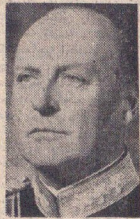
اعلیحضرت اولاد پنجم پادشاه تروژ

پادشاهانی که در مراسم جشن های شاهنشاهی حضور دارند