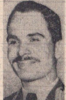
اعلیحضرت ملکحسین پادشاه اردن