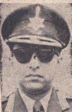
اعلیحضرت مائری پادشاه مائری