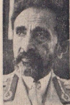
اعلیحضرت هایلاسالی امپراطور اتیوپی