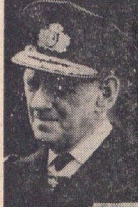
اعلیحضرت فردریک نهم پادشاه دانمارک