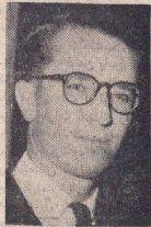
اعلیحضرت بودون پادشاه بلژیک