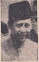
اعلیحضرت عبدالملک پادشاه مراکش