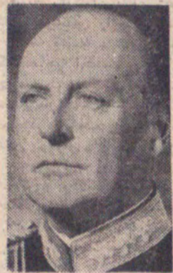
اعلیحضرت اولاد پنجم پادشاه نروژ