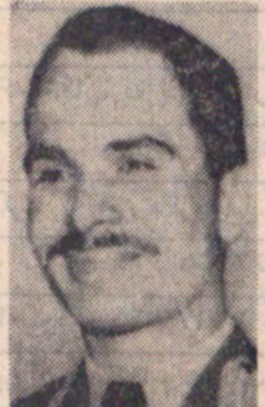
اعلیحضرت ملکحسین پادشاه اردن