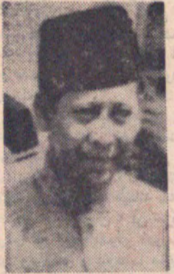
اعلیحضرت عبدالحمیدمطلبشاه پادشاه مالزی