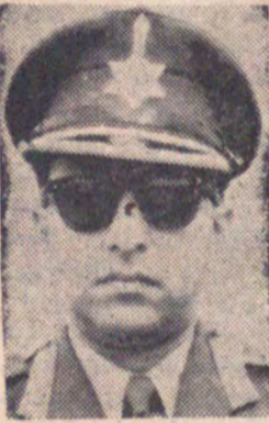
اعلیحضرت ماهدرا ابیریکرم شاه دوا پادشاه نیال