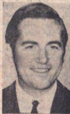
اعلیحضرت کنستانتین پادشاه یونان