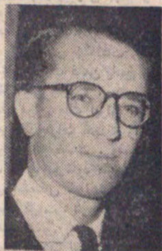
اعلیحضرت بودون پادشاه بلژیک