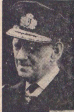
اعلیحضرت فردریک نهم پادشاه دانمارک