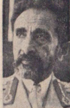
اعلیحضرت هایلاسلاسی امپراطور اتیوپی