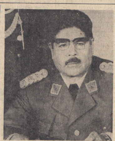
این یکی از آخرین عکسهاست که چند روز قبل از آغاز شورش دست راستی‌های بولیوی از یوزریدنت خوان تورز رئیس جمهوری خلق بولیوی گرفته شده است.

ملکرات وزیران خارجه ایران، ترکیه و پاکستان با بان یافت