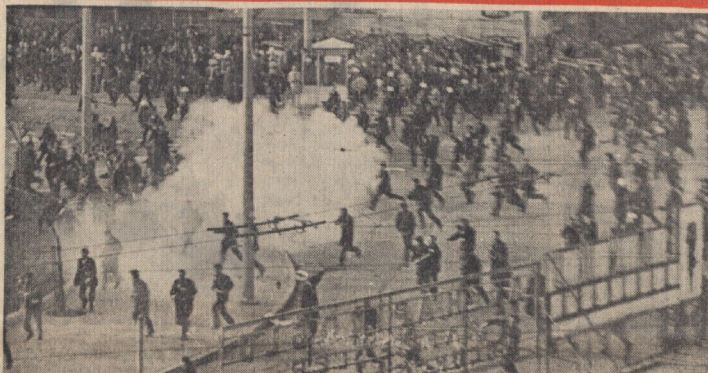
شورشیان بولیوی که اینک گزارش میسر شد هشتاد درصد کشور را زیر کنترل دارند امروز نیز چون سه روز گذشته به زدوخورد های خونی با سربازان وفادار رژیم مورون ادامه دادند. از لایز گزارش رسید که شدت زدوخورد ها این شهر را به حمام خون میل کرده است. شورشیان در این عکس با کمک مواد منفجره و دیگر سلاح ها میگویند صفوف افراد پلیس و سربازان را درهم شکنند.

شورشیان اعلام کردند رژیم دست چپی بلیوی سرنگون شده است