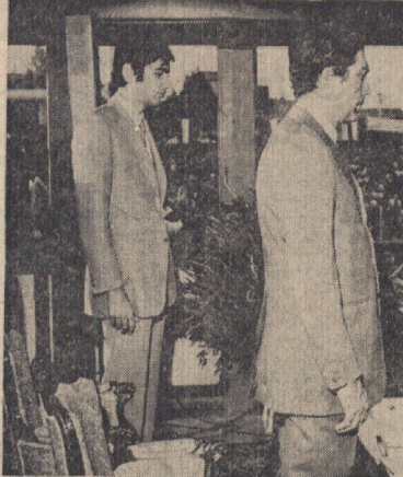
هنرمندان کشور آغاز شد که تا ساعت ۹ بعد از ظهر جشن بطول انجامید.

جشن جامعه ورزشی در حضور والا حضرت شاهپور غلامرضا پهلوی