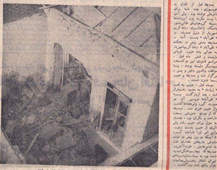
گوشه ای از خانه شماره ۱۳ سی از انفجار گاز

دختر جوانی به نام شکست عشق و خودمندی کرد و ۱۶ ساله بود. صدیقه قبل از اقدام به خودکشی، چند ماه برای نامزدی خود نوشته بود و ولی آنرا را دست نگه دارد. این نامهها وسیله گروهبانک طالبی نامور و پاسگاه آذربایری رباط کریم به شیراز از منزل صدیقه در تهران پاریس است. صدیقه با دوستی در مشهد در آنجا با یک جوانی آشنا شد و به نامزدی او درآمد. نام او را شکست نامیدند و نام خانوادگی او را شکست نامیدند. شکست در این خانه زندگی کرد و به نامزدی او درآمد. نام او را شکست نامیدند و نام خانوادگی او را شکست نامیدند.