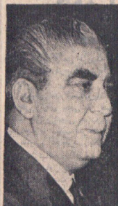
ژنرال حبیبی خان ضمن نطق شدیدالحنی گفت اجازه نخواهد داد پاکستان تجزیه شود.