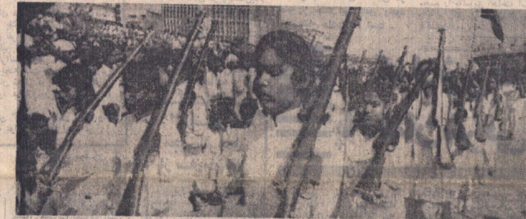
گروهی از دختران پاکستان شرقی در حالی که تفک بدوش گرفته اند از خیابان های داکا عبور میکنند.

پلیس و چریکهای مسلح پاکستان شرقی به طرفداران مجیب الرحمن پیوستند