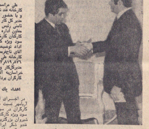
آقای نامتی چک سود ویژه کارگران را به مدیر کل اداره کار و امور اجتماعی خراسان میدهد.

باهدای کتاب به دوستان و دوستانان خود بهارشان را جاودان سازید برای خرید نفیس ترین کتابها در تهران بفرشوگاههای مؤسسه انتشارات امیرکبیر و در شهرستانها بنمایندگان این مؤسسه مراجعه فرمایید