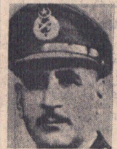
ژنرال نکه خان فرماندار نظامی پاکستان شرقی دستور گرفته است که تئوریست راسکوب کند.

دادجوی سری جنتیویان پاکستان شرقی اعلام کرد جنگ تا استقلال کامل پاکستان شرقی ادامه خواهد داشت