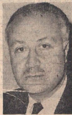
تلق مهم خت بری در مجمع عمومی سازمان ملل توجه محافل سیاسی جهان را جلب کرد

وزیر خارجه اخطار کرد باروشی که اسرائیل در پیش گرفته از مصر نمیتوان انتظار داشت آتش بس را بطور نامحدود ادامه دهد