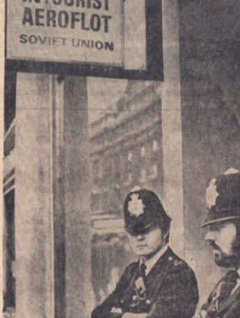
مأمورین پلیس لندن در مقابل دفتر هواپیمایی شوروی (تروفوت) در لندن

دیروز هواپیمای خط هوایی لنده و مسکو بطور عالی پرواز خود را از تهران آغاز کرد. این پرواز در میان مسکو و تهران دو کشور آغاز شد. شاهنشاهی ایران وسیله نقلیه ششگانه گمرکی نخبین بار از مرز مکتبته بهای منطقه از خاک ترکیه شترخیزها شده و با نماند صورت جویونجایی، تریک جویونجی، تریک خرماسه نقلی عمر در گلستان شد. این تریک گرده بوده. و هواپیمای جمعا با ۹۶ مسافر که ۵۴ نفر خدمت های پرچمت شوروی و مابقی خدمت ویزران و مسافری از کل بیست ستو وهران دوشوریا را ملازمت میکردند. تفصیل این شریعت تاریخی را ضمن گزارش بیگانه جگانه ملاحظه خواهد کرد. و بطوریکه در گزارش مکتبی است شاهنشاهی ایران از حضور این تریک جویونجی، تریک و تریک در فرامی کسوروت مخرجات بظمان فرمت ستو وهران گلستان و گرانبها و تاریخی یاد کرده اند.