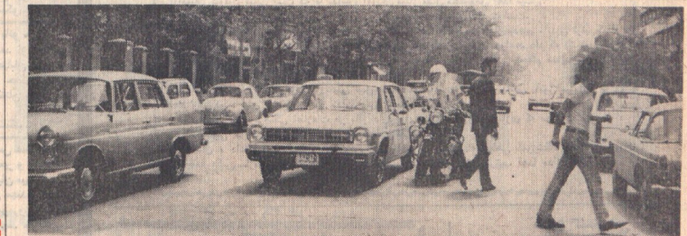
در ده هزار خانه شوشه، انواع ناسیمات و مبدلها و بارگ ها و خیابانها، که در موانع

ساعات شریعی آذان صبح . . . . . ساعت ۵:۳۰ دقیقه طلوع آفتاب . . . . . ساعت ۷:۰۵ دقیقه غروب آفتاب . . . . . ساعت ۱۷:۲۴ دقیقه آذان عרב . . . . . ساعت ۷ و ۲۵ دقیقه