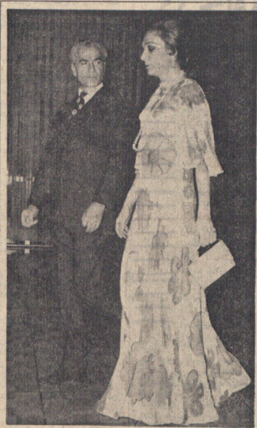
شاهنشاه آریامهرو علیا حضرتشهبانو دیشب از برنامه هنری «الوین نیگلی» هنرمند معروف آمریکائی و گروه «رفس تجسمی» او در تالار رودکی دیدن کردند. عکس اعلیحضرتین را در پایان دیدار از برنامه مذکور در سراسرای تالار رودکی نشان میدهند.

وزیر آموزش و پرورش گفت : پیشنهادات معلمان درباره آئیننامه طبقه بندی مشاغل تا يك هفته دیگر پذیرفته میشود پنجمین قسمت سئوالات معلمان و پاسخ آموزش و پرورش در صفحه ۴