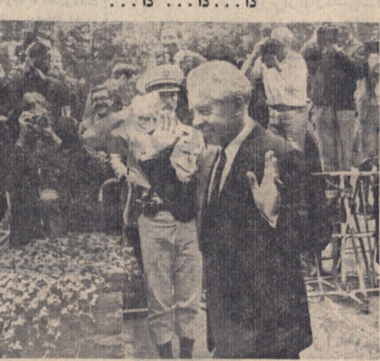
سفرای چهار کشور بزرگ سوئیس و غرب در سی و سومین جلسه مذاکرات خود درباره کلیه مسائل مربوط به برلن برگزار کردند. طرح فراردهی برای پایان دادن به اختلافات ۲۷ ماده ای بین نمایندگان در یک اسناد سه جانبه در سوئیس در روز سه شنبه ۲ شهریور در سوئیس امضا شد.